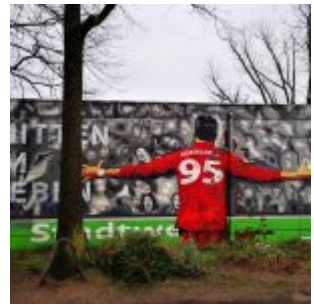
Fortuna am Kolpingplatz