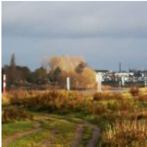
In der Kämpe - Richtung Reisholzer Hafen (Sommer 2019)