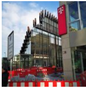
Am Kö-Bogen II