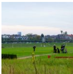
Golfen auf der Lausward (2014)