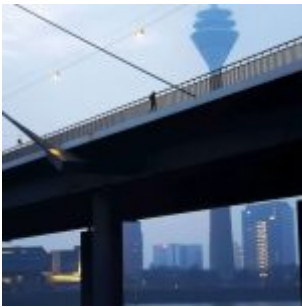
Kniebrücke am Neujahrstag 2021