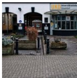
UKD

Im Instagram-Stream von The Düsseldorf veröffentlichten wir jeden Tag ein Bild aus Düsseldorf. Und weil so viele Leserinnen und Leser diese Fotos mögen, sammeln wir die Bilder eines Monats und präsentieren sie noch einmal hier als Album. Dies sind die Bilder aus dem Februar 2021.