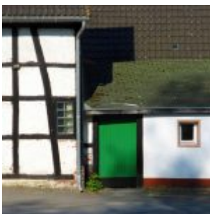
Stinder Mühle bei Erkrath