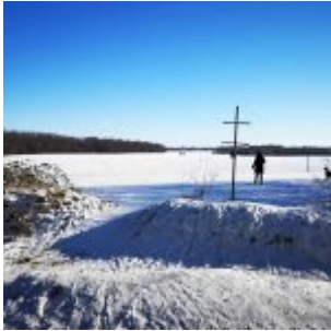
Aaper Wald, ganz oben