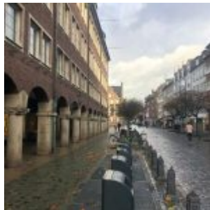
An der Kämmeri im Lockdown