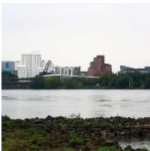
Drüben die Gehry-Bauten (Oktober 2020)