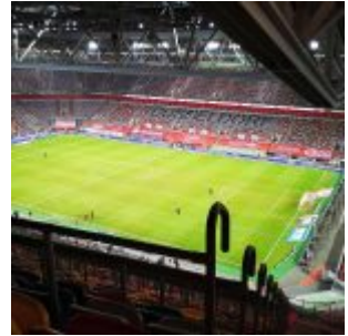
Arena ganz oben