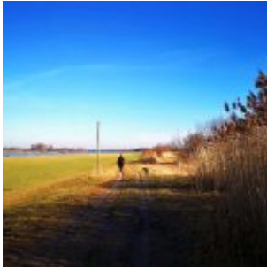
Nah Kaiserswerth