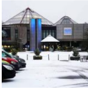
Aquazoo im Schnee