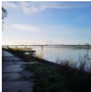
Morgendunst über dem Rhein bei Hamm