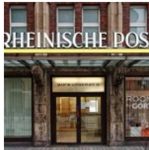
Rheinische Post (Foto: M. Neugebauer)