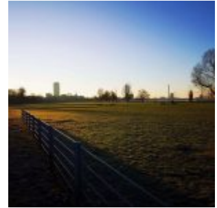
Rheinpark Golzheim, Richtung Ergo