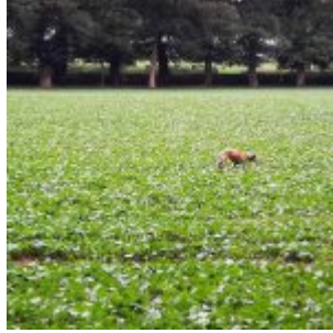
An der Kastanienallee am Aaper Wald (Spätsommer 2020)