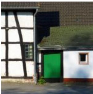
Stinder Mühle bei Erkrath