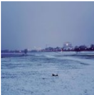
Richtung Vodafone (Januar 2021)