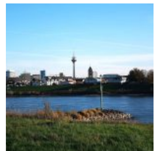
Blick nach Hamm