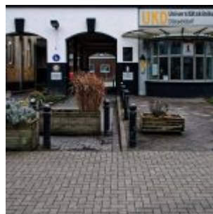
UKD

Im Instagram-Stream von The Düsseldorfer veröffentlichen wir jeden Tag ein Bild aus Düsseldorf. Und weil so viele Leserinnen und Leser diese Fotos mögen, sammeln wir die Bilder eines Monats und präsentieren sie noch einmal hier als Album. Dies sind die Bilder aus dem Februar 2021.