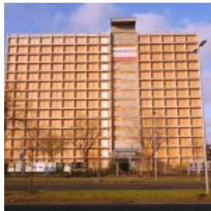
Abrisshaus an der Völklinger Straße