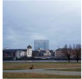
3-Scheibenhaus hinter der Altstadt