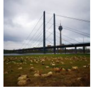
Schafe an der Kniebrücke