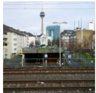
Blick in die Tunnelmündung