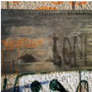
Gedenktafel Oberkasseler Brücke