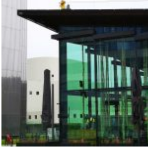
Am Kö-Bogen II