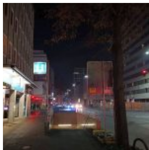
Oststraße bei Nacht