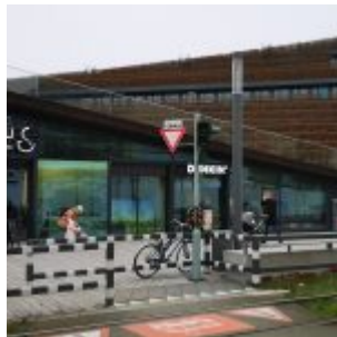
Dreicksbau am Kö-Bogen