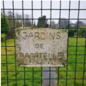
An einem Niederkasseler Kleingarten