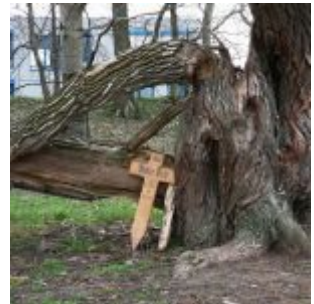
Auf der Lausward