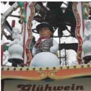
Beuys und Glühwein