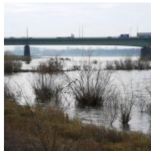
Hochwasser an der Südbrücke

Im Instagram-Stream von The Düsseldorfer veröffentlichen wir jeden Tag ein Bild aus Düsseldorf. Und weil so viele Leserinnen und Leser diese Fotos mögen, sammeln wir die Bilder eines Monats und präsentieren sie noch einmal hier als Album. Dies sind die Bilder aus dem Februar 2022.