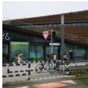
Dreicksbau am Kö-Bogen