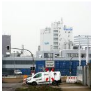
Blick in den Hafen