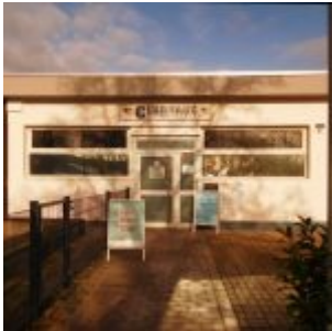
Clubhaus Sparta Bilk