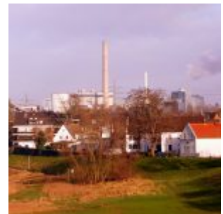
Über Hamm bis zum Kraftwerk