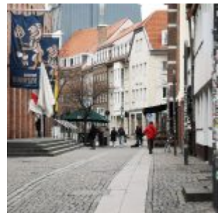
Düsselblick Februar 2022: Ratinger Mauer