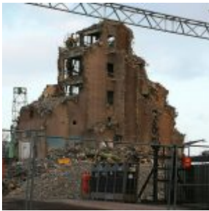
Abriss im Hafen