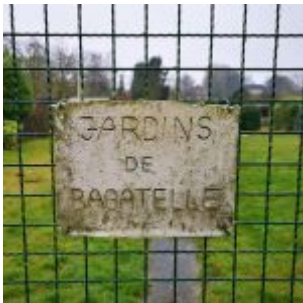
An einem Niederkasseler Kleingarten