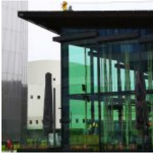
Am Kö-Bogen II