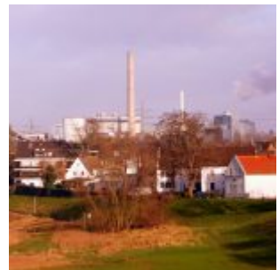
Über Hamm bis zum Kraftwerk