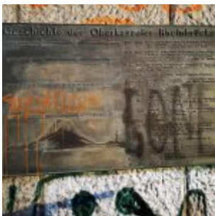
Gedenktafel Oberkasseler Brücke