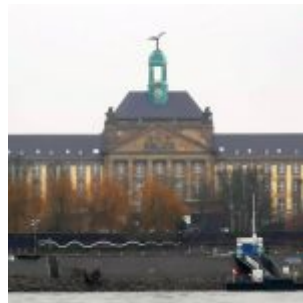
Adler und Schlange