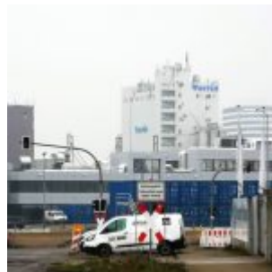
Blick in den Hafen