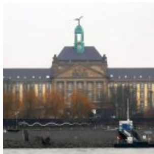
Adler und Schlange