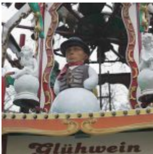
Beuys und Glühwein