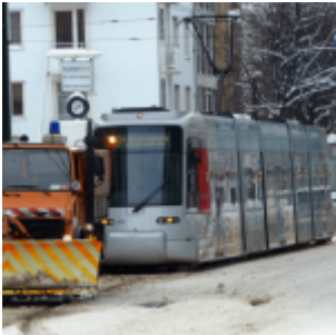
Schneeflug auf der Oberbilker Allee (Winter 2010/11)