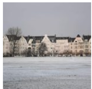
Oberkassel mit Schnee