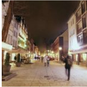
Bolkerstraße, Winter, abends