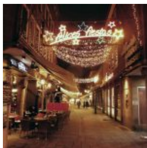
Schneider-Wibbel-Gasse zu Weihnachten