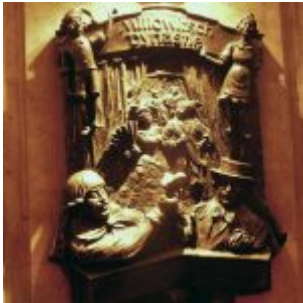
Millowitsch-Gedenkbronze am Uerige