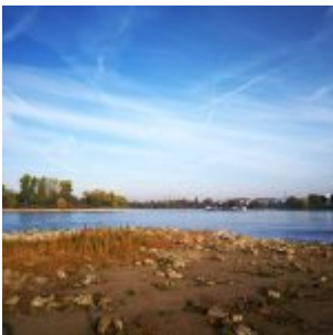
Blick auf den Reisholzer Hafen