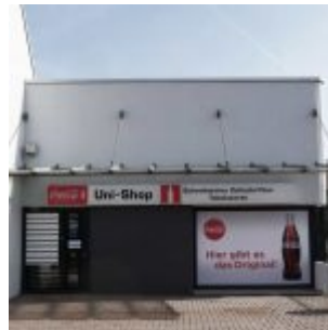
Uni-Shop (April 2017)

[Anklicken zum Vergrößern] Auf der Facebook-Seite von The Düsseldorfer veröffentlichen wir jeden Tag ein Bild aus Düsseldorf. Und weil so viele Leserinnen und Leser diese Fotos mögen, sammeln wir die Bilder eines Monats und veröffentlichen sie noch einmal hier als Album. Dies sind die Bilder aus dem Januar 2019.