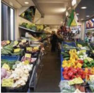
Gemüsestand Schier auf dem Carlsplatz