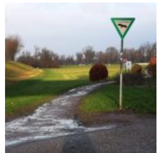
Die Löricker Rheinwiese