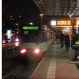
Die Bahn kommt