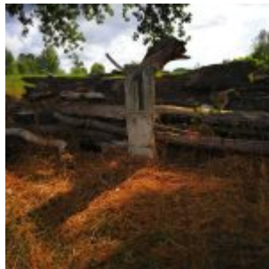
Nr. 1 - in der Urdenbacher Kämpe