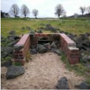
Eingang zur Unterwelt (Hamm)