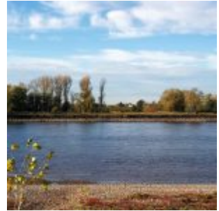
Das Haus gegenüber