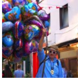
Ballonverkäufer auf der Kurzestraße (Sommer 2016)