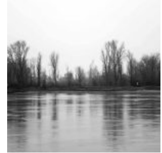
Ölgangsinsel im Winter