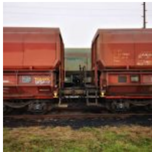
Waggons im Hafen