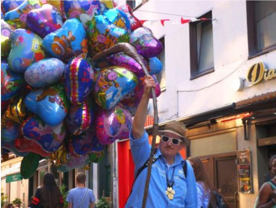
Der Ballonmann auf der Kurzestraße