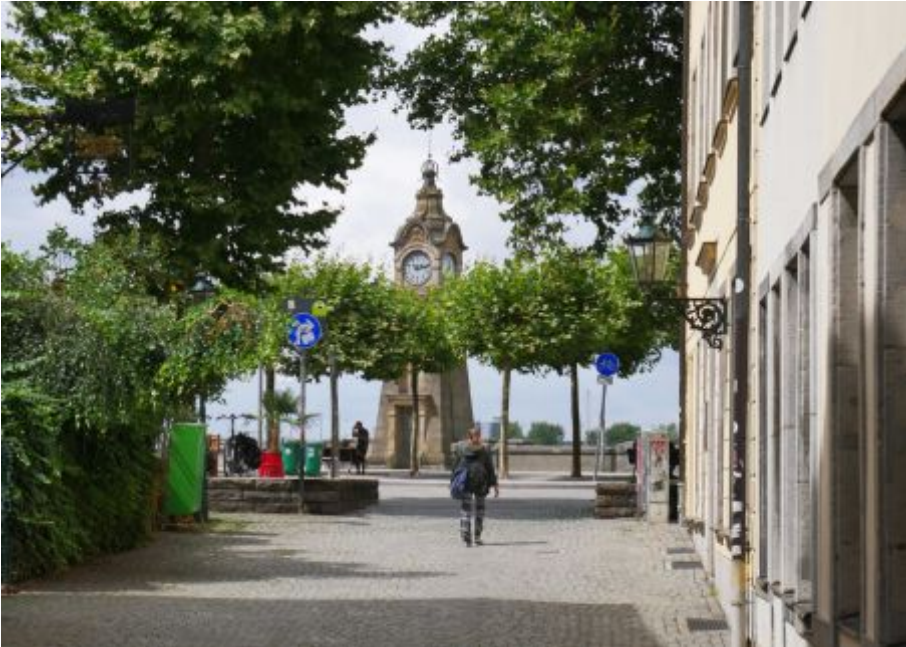
Blick durch die Zollstraße zur Pegeluhr