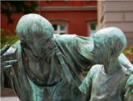
Meister und Lehrling