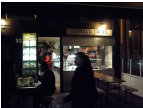
Ferrel's Hütte (2011)