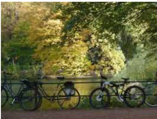
Am Spee'schen Graben (2011)