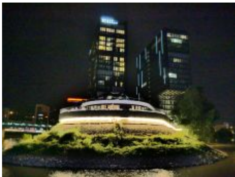
Hyatt Regency im Medienhafen