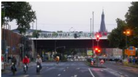
Frei für Radler