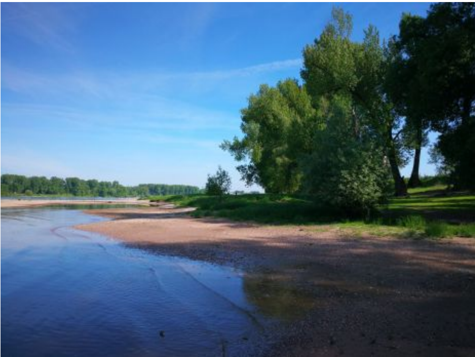
In der Urdenbacher Kämpe