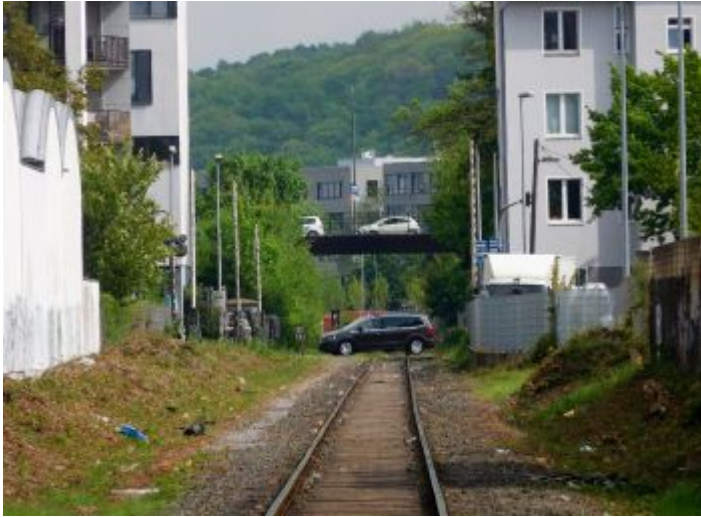
Blick zur Bruchstraße