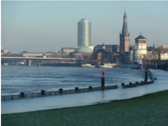
Hochwasser im Januar 2011