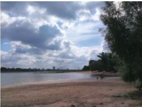
Bucht bei Lörick