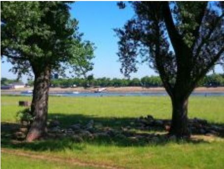
Schafe bei Lörick