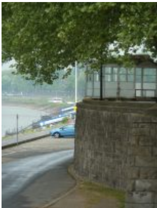
Musikpavillon der Rheinterrasse (2010)