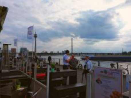
An den Kasematten