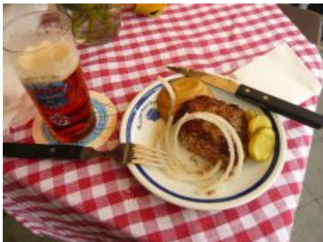
Frikadellchen beim Schumacher