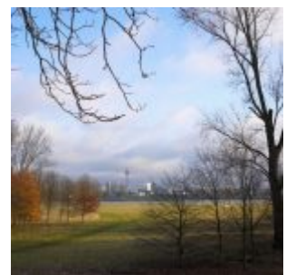
In der Ferne