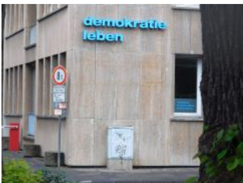
Landeszentrale für politische Bildung