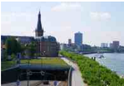
Einfahrt zum Rheinufertunnel