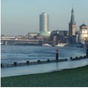
Hochwasser im Januar 2011