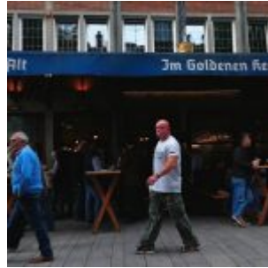
Im Goldenen Kessel