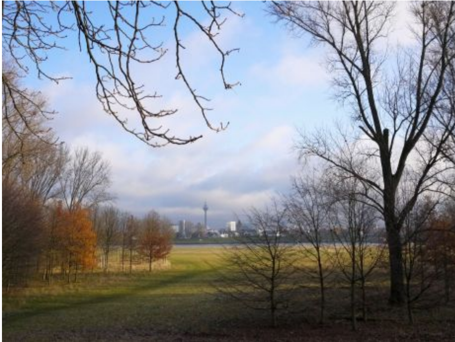
In der Ferne