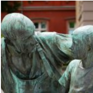
Meister und Lehrling