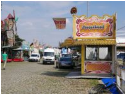
Brezeln auf der Kirmes