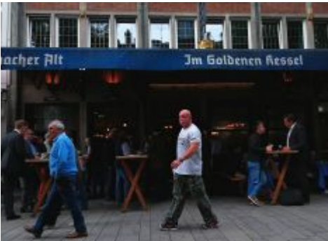
Im Goldenen Kessel