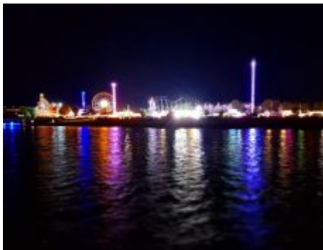
Größte Kirmes am Rhein, nachts