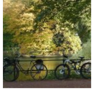
Am Spee'schen Graben (2011)