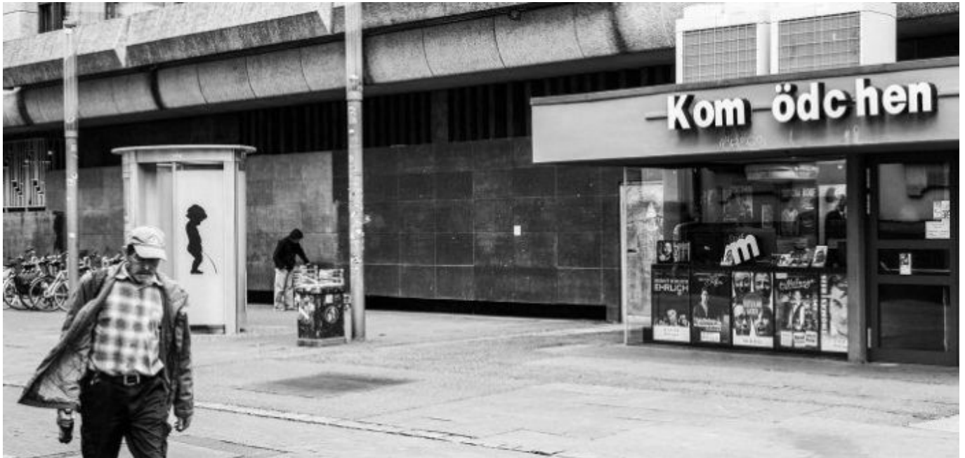
Kom(m)ödchen (M. Neugebauer)