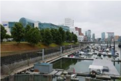
Marina im Medienhafen