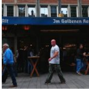
Im Goldenen Kessel