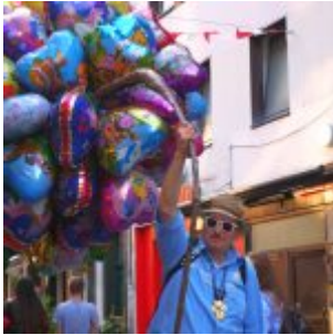
Der Ballonmann auf der Kurzestraße