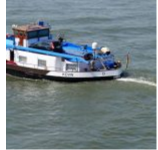
Ein Schiff namens Kevin

Auf der Facebook-Seite von The Düsseldorfer veröffentlichen wir jeden Tag ein Bild aus Düsseldorf. Und weil so viele Leserinnen und Leser diese Fotos mögen, sammeln wir die Bilder eines Monats und veröffentlichen sie noch einmal hier als Album. Dies sind die Bilder aus dem Juli 2017.