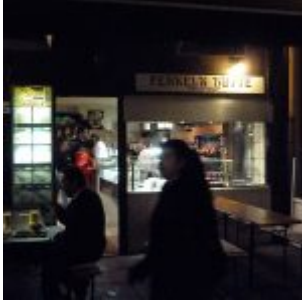
Ferkel's Hütte (2011)