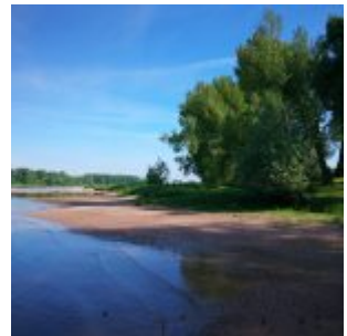
In der Urdenbacher Kämpe