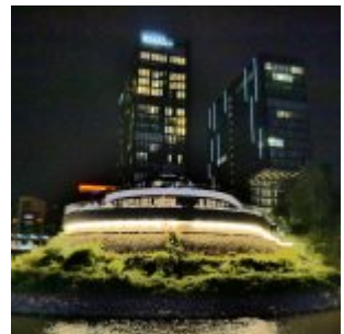
Hyatt Regency im Medienhafen