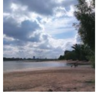
Bucht bei Lörick