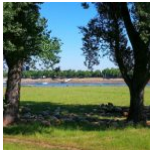
Schafe bei Lörick