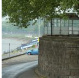
Musikpavillon der Rheinterrasse (2010)