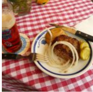
Frikadellchen beim Schumacher