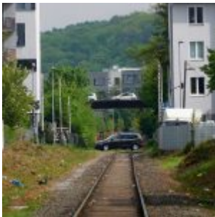
Blick zur Bruchstraße