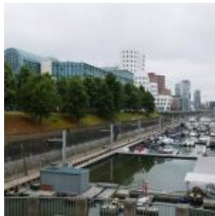
Marina im Medienhafen (A.Otto)