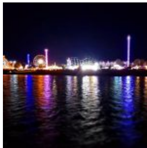
Größte Kirmes am Rhein, nachts