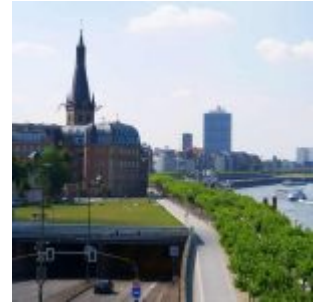
Einfahrt zum Rheinfertunnel