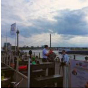
An den Kasematten