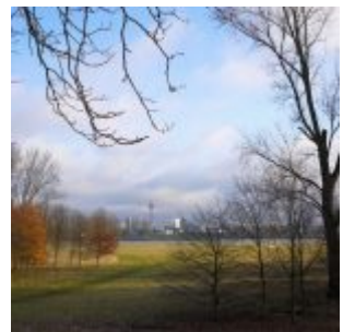
In der Ferne