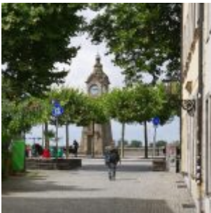
Blick durch die Zollstraße zur Pegeluhr