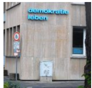
Landeszentrale für politische Bildung