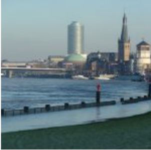
Hochwasser im Januar 2011