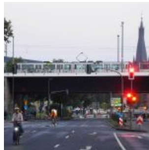
Frei für Radler