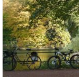
Am Spee'schen Graben (2011)