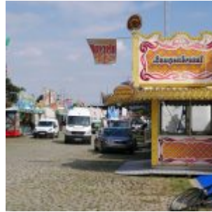
Brezeln auf der Kirmes