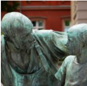
Meister und Lehrling