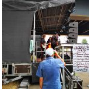
An der Bühne (Golzheimer-Fest 2019)