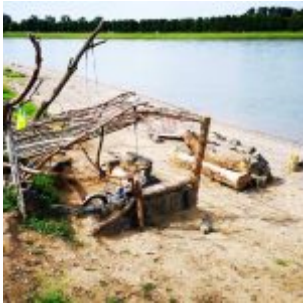
Lager am Rhein