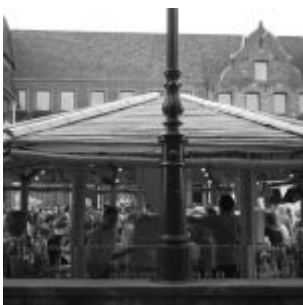
Marktplatz (Jazz-Rallye 2016)