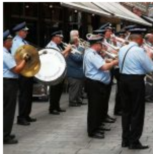
Blasmusik auf der Bolkerstraße