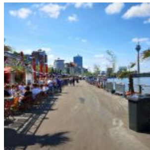
Unteres Rheinwerft