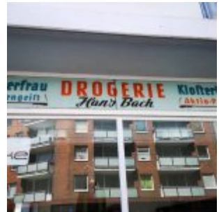
Drogerie Hans Bach, Ackerstraße