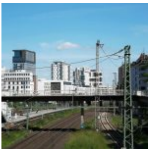
Groß, lang, teuer und öde: Le Flair an der Toulouser Allee