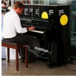
Asphalt Festival: Öffentliches Klavier