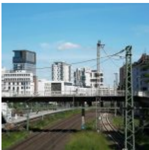
Groß, lang, teuer und öde: Le Flair an der Toulouser Allee