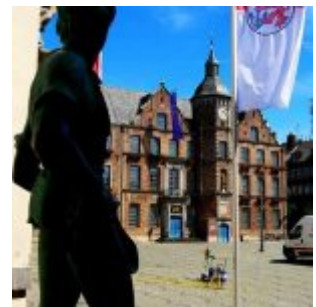
Blick auf den Marktplatz (A. Otto)