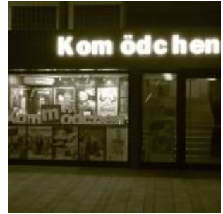
Das Kom(m)ödchen in der Kunsthalle