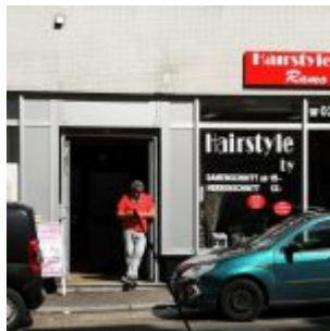
Fairstyle Remo , Ackerstraße