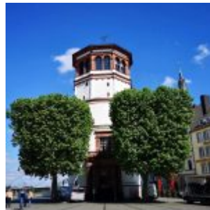
Düsselquiz 100: Gesucht war der Schlossturm