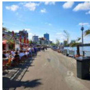
Unteres Rheinwerft