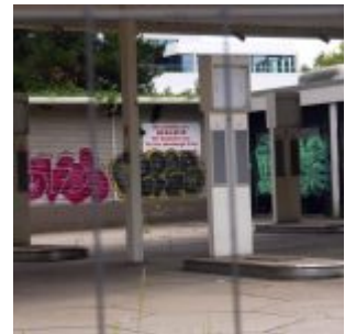
Aufgegebene Tanke, Rosstraße