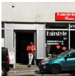
Fairstyle Remo , Ackerstraße