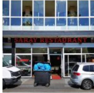
Saray, Worringer Straße