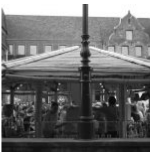
Marktplatz (Jazz-Rallye 2016)