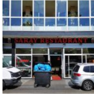
Saray, Worringer Straße