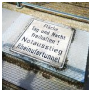
An der Rheinuferpromenade