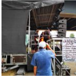
An der Bühne (Golzheim-Fest 2019)