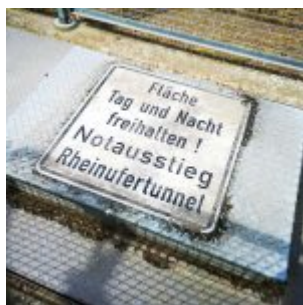
An der Rheinuferpromenade