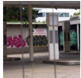
Aufgegebene Tanke, Rosstraße