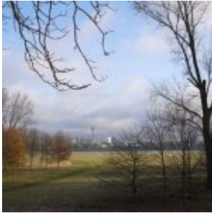
Blick nach Düsseldorf