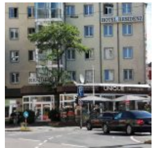
Hotel Residenz, Worringer Platz