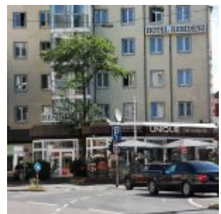
Hotel Residenz, Worringer Platz