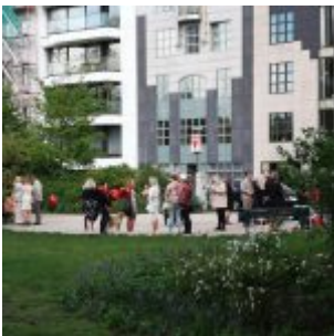
Hochzeit an der Inselstraße