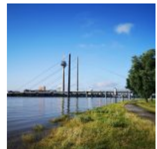
Mittleres Hochwasser an der Oberkasseler Rheinwiese