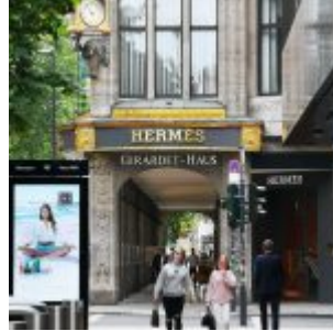
Giradet-Haus an der Kö