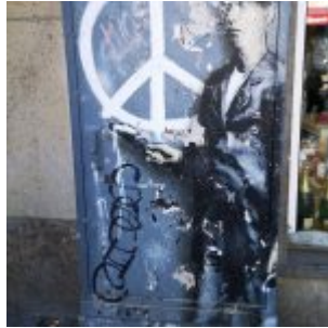
Fast wie Banksy (Nordstraße)