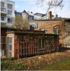
Das Gartenhaus im Malkasten- Park