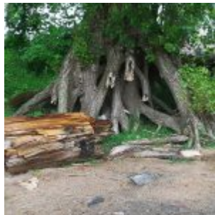
Baumriese in der Kämpe