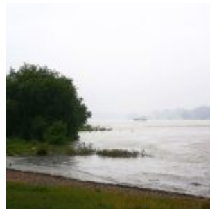
Hochwasser am Niederrhein