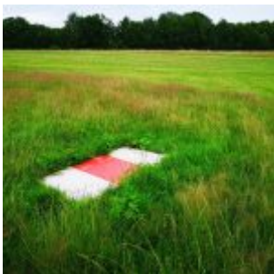
Markierung auf der Segelflugweise