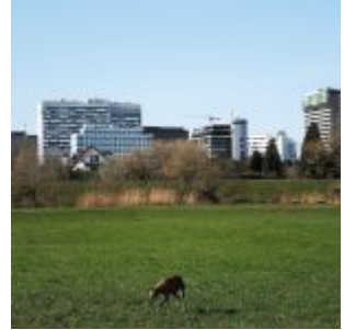
Blick zum Seestern