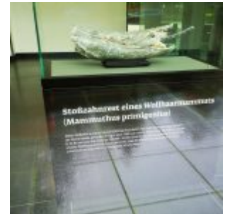
Mammutzahn in der Ergo.IT