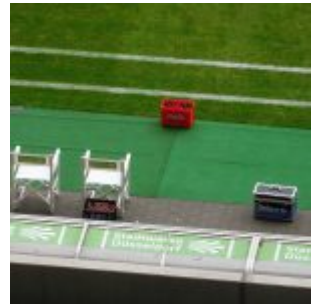
Gästebank in der Arena