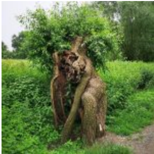
Baumgeist in der Kämpe