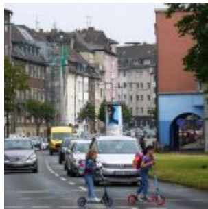
Blich in die Euöerstraße