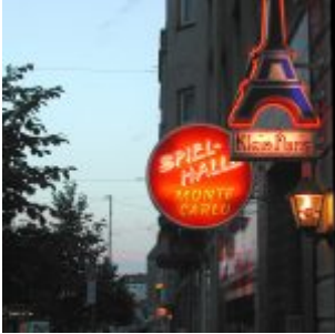
Klein-Paris an der Mintropstraße (2004; Foto: TD)