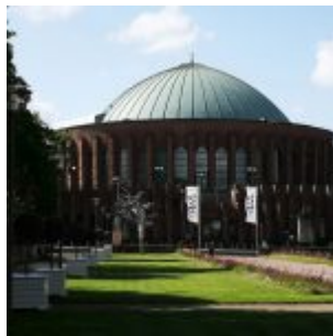
Die Tonhalle vom Ehrenhof aus gesehen