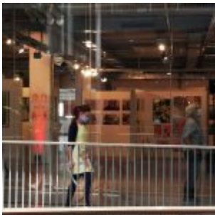
Durchblick im Stilwerk