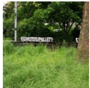
Bank in Oberkassel