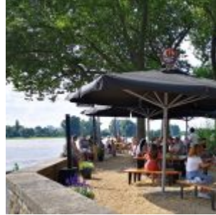
Biergarten an der Rheinterrasse Strandgut nach dem Hochwasser