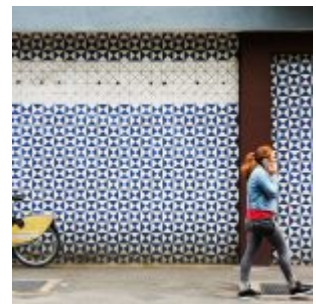
Ehemalige Tankstelle an der Prinz-Georg-Straße