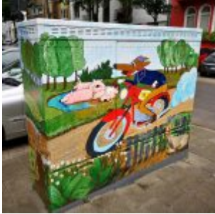
Schön bemalter Stromkasten an der Ehrenstraße