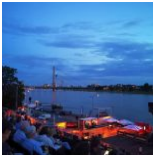
Im Open-Air-Kino im Rheinpark Golzheim

Im Instagram-Stream von The Düsseldorfer veröffentlichen wir jeden Tag ein Bild aus Düsseldorf. Und weil so viele Leserinnen und Leser diese Fotos mögen, sammeln wir die Bilder eines Monats und präsentieren sie noch einmal hier als Album. Dies sind die Bilder aus dem Juli 2021.