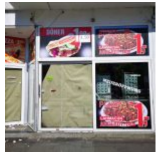
Neueröffnung, Worringer Straße