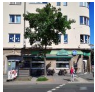
Billardforum am Worringer Platz