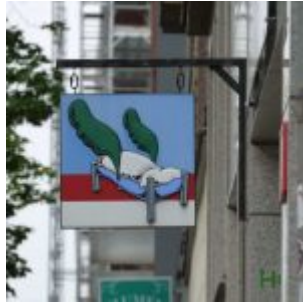
Hostel am Fürstenwall