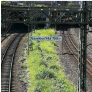
Düsseldorf bf 750 m