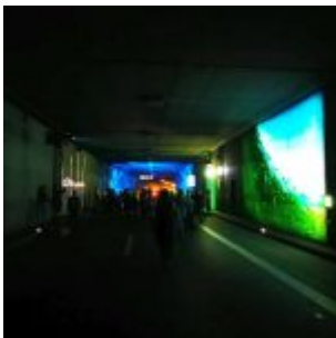
Kunst im Tunnel