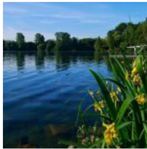
Morgens am Unterbacher See (A. Otto)