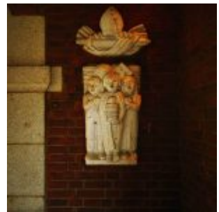
An der Alten Kämmererei