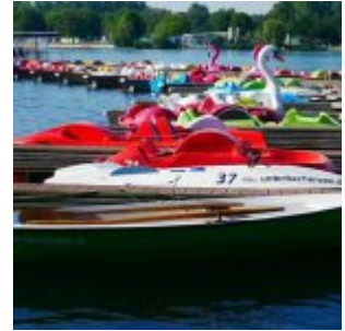
Morgens am Unterbacher See (A. Otto)