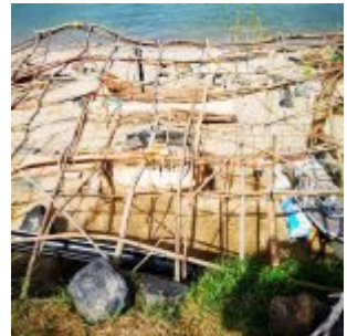
Lager am Rhein