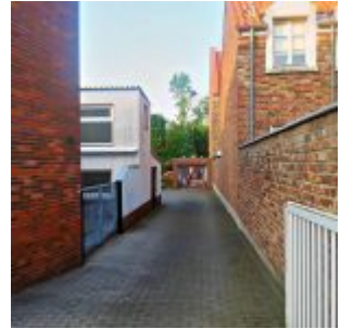
Pferd im Hof, Niederkassel(H. Brandl)