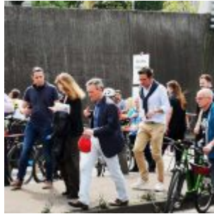
...und regelt den Verkehr