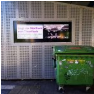
Das D'haus un der Müll