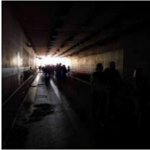
Düsseldorfer im Tunnel