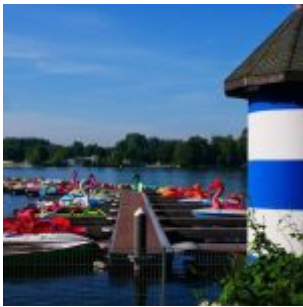
Morgens am Unterbacher See (A. Otto)