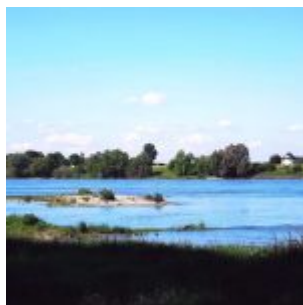
Blick Richtung Zons