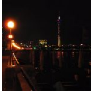
Rheinpromenade, nachts (2016)