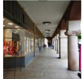
Arkaden an der Alten Kämmererei