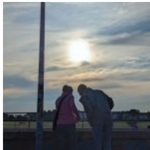
Abends am Rhein