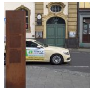
Mahn- und Gedenkstätte