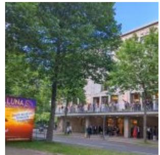
An der Oper