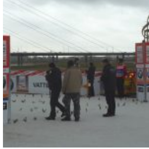
2011: Skilanglauf Worldcup