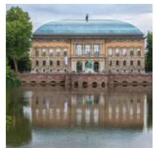
Ständehaus, K21