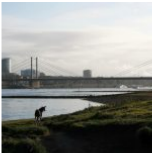
Kleiner Hund, große Stadt