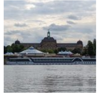
Roncalli vor der Bezirksregierung