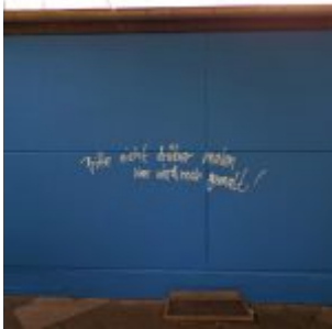
Wird noch gemalt