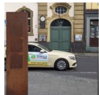
Mahn- und Gedenkstätte