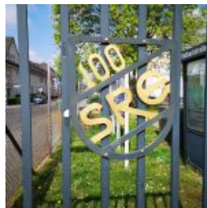
Sportring Eller, Tor