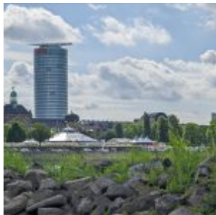
Roncallo vor Ergo