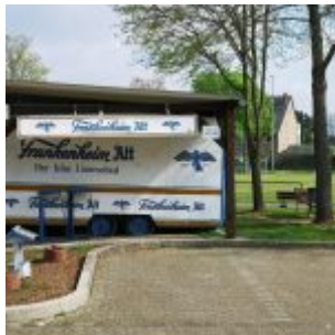
Sportring Eller, Bierwagen