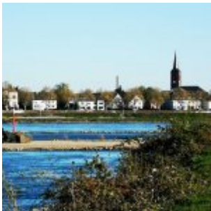
Angler vor Uedesheim