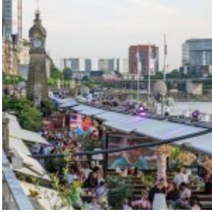
3. Juni 22, 20 Uhr