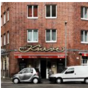
Die Kurve, Pempelfort