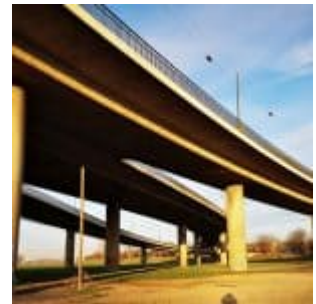
Unter der Kniebrücke (Sommer 2018)