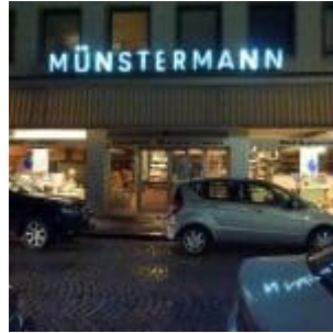
Delikatessen Münstermann auf der Hohe Straße (2009)

[Anklicken zum Vergrößern] Auf der Facebook-Seite von The Düsseldorfer veröffentlichen wir jeden Tag ein Bild aus Düsseldorf. Und weil so viele Leserinnen und Leser diese Fotos mögen, sammeln wir die Bilder eines Monats und veröffentlichen sie noch einmal hier als Album. Dies sind die Bilder aus dem März 2019.