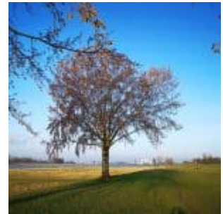
Baum auf der Rheinwiese