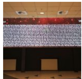
Wall of Fame, Philipshalle