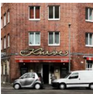
Die Kurve, Pempelfort