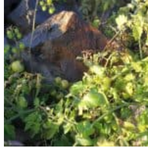
Rheintomaten bei Heerdt - Erinnerung an den heißen Sommer 2018