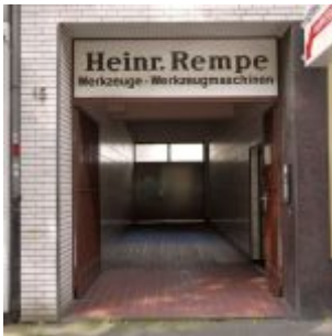
Heinr. Rempe, Talstraße (Mai 2015)