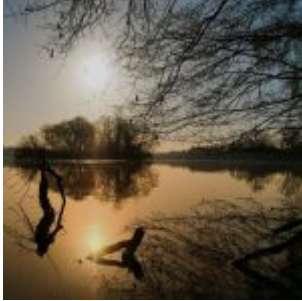
Unterbacher See, frühmorgens (A. Otto)