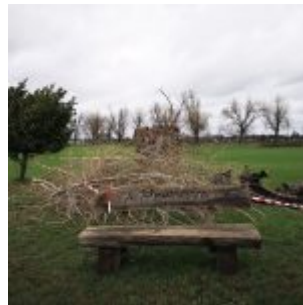
Schmittmann-Bank auf der Löricker Rheinwiese