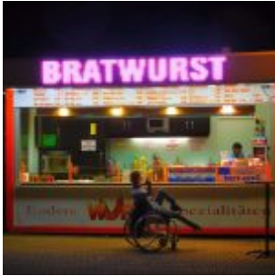
Bratwurst am Hauptbahnhof