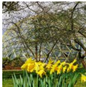
Frühling im Botanischen Garten (A. Otto)