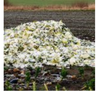
Kappes bei Hamm