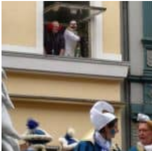
Rosenmontag 2011 an der Friedrichstraße