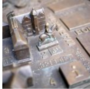
Bronzmodell der Altstadt am Rathaus