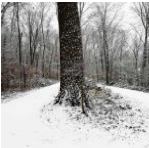
Verschneiter Eller Forst