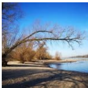
Lörickstrand im Februar