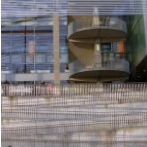
Rolli-Rampe an der Arena (2015)