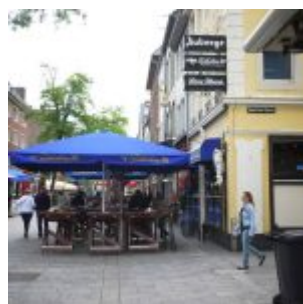
Auberge, Bolkerstraße (2014)