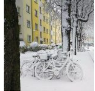
Schneeräder (Winter 2011/12)