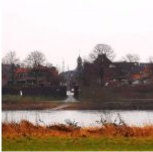
Eingang von Hamm