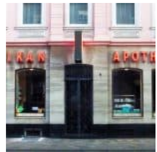
Pelikan-Apotheke, Volmerswerther Straße (2015)