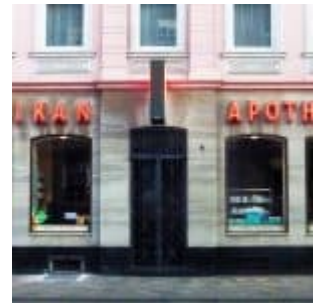
Pelikan-Apotheke, Volmerswerther Straße (2015)