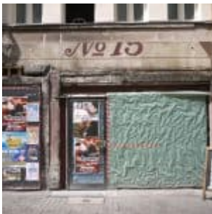
Hunsrücken No. 15 (Mai 2014)