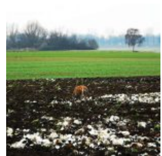
Kappesacker bei Flehe