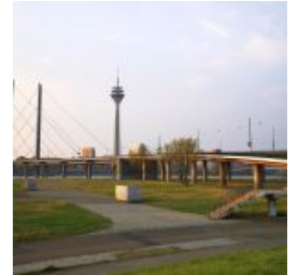
20. März, 7:20, 5°