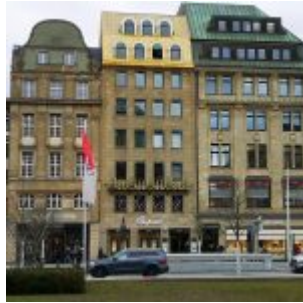
Luxusblock an der Kö