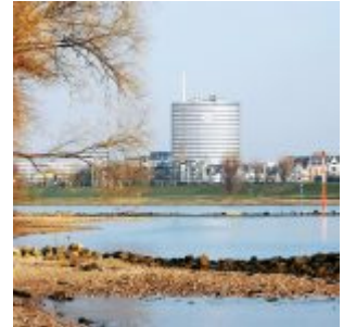
Blick rüber zu Vodafone