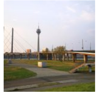
20. März, 7:20, 5°