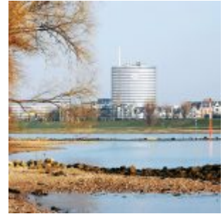
Blick rüber zu Vodafone