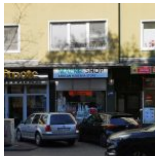
An der Hüttenstraße