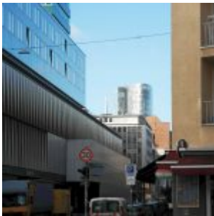
Durchblick zum GAP