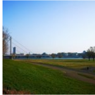
20. März, 7:20, 5°