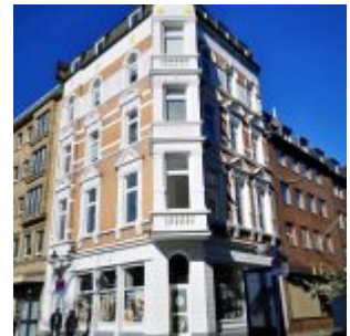
Eckhaus am Carlsplatz