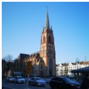
St. Peter am Kirchplatz