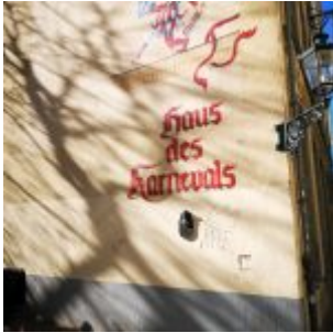
Haus des Karnevals