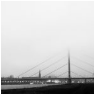
Südbrücke im Gegenlicht