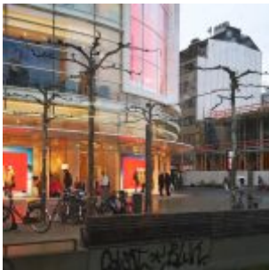
Peek & Cloppenburg