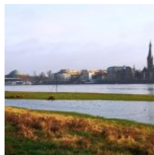
Hochwasser im Januar 2022