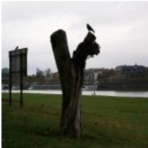
Krähe am Rhein