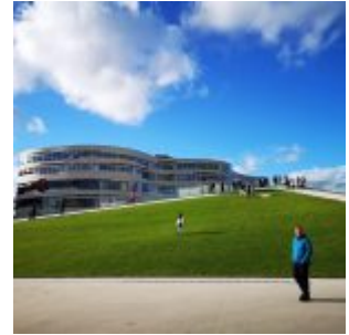
Dreieck am Kö-Bogen