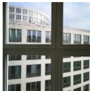
Vom Kunstpalast auf den E.on- Keks