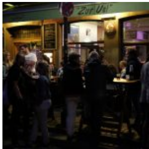
Vor der Uel