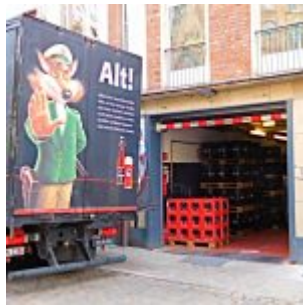
Hinten am Füchschen