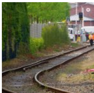
Gleisgänger, Kraftwerk Flingern