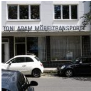
Toni Adam Möbelspedition