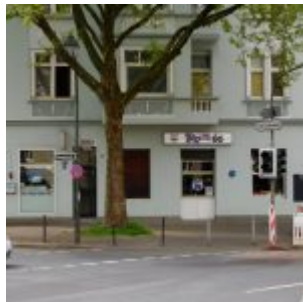
Route 66, Bruchstraße