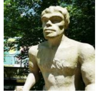
Die Neanderthaler hatten so große Nasen, um besser Luft zu kriegen