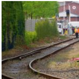
Gleisgänger, Kraftwerk Flingern