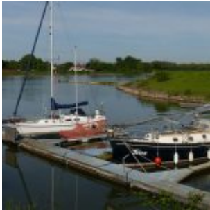
Kleiner Yachthafen (A.Otto)