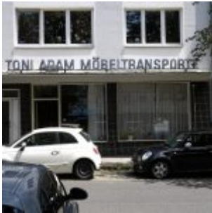
Toni Adam Möbelspedition