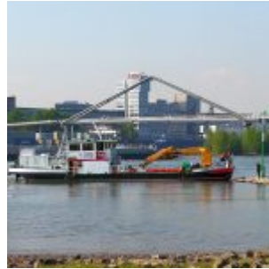
Arbeiten am Fahrwasserzeichen