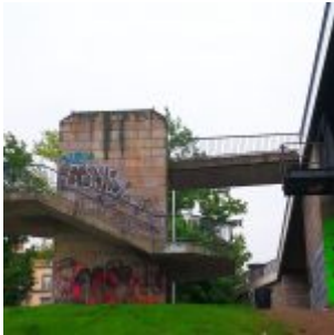
Aufgang an der Oberkasseler Brücke