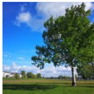
Auf der Rheinwiese