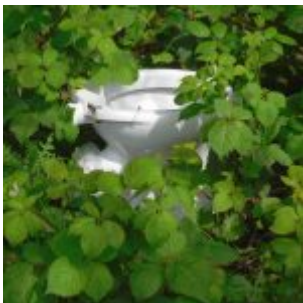
Klo am Hellweg