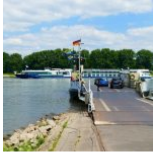
Hitdorfer Rheinfähre (A.Otto)