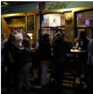
Vor der Uel