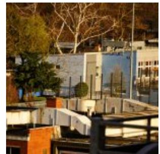
Blick zum TuRU-Platz