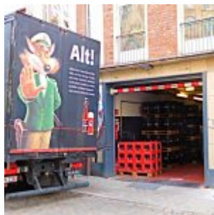
Hinten am Füchschen