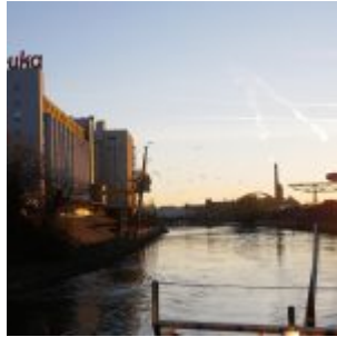
An Bord im Hafen