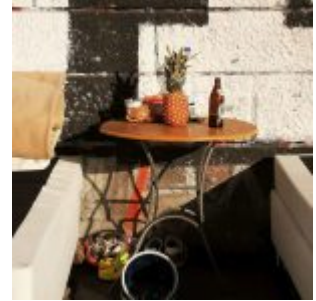
Unter der Kniebrücke

[Anklicken zum Vergrößern] Auf der Facebook-Seite von The Düsseldorf veröffentlichten wir jeden Tag ein Bild aus Düsseldorf. Und weil so viele Leserinnen und Leser diese Fotos mögen, sammeln wir die Bilder eines Monats und veröffentlichen sie noch einmal hier als Album. Dies sind die Bilder aus dem Mai 2019.