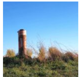
Messrohr bei Lohausen