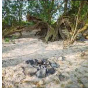
Lagerstätte am Rhein