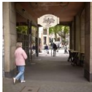
Em Kabüffke auf der Flinger Straße - Killepitsch direkt am Fenster