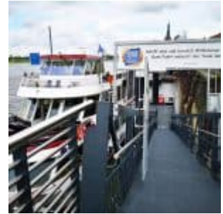
Steiger der Weissen Flotte