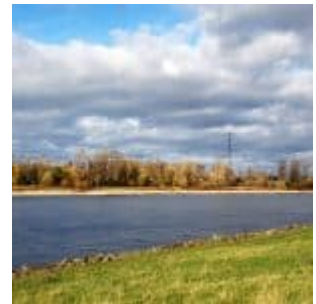
Blick von der Lausward