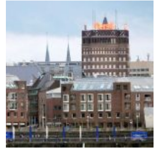
Damit fing die Ära der Hochhäuser in Düsseldorf an: das Wilhelm-Marx-Haus