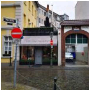
Am Maxplatz zwischen Carlstadt und Altstadt