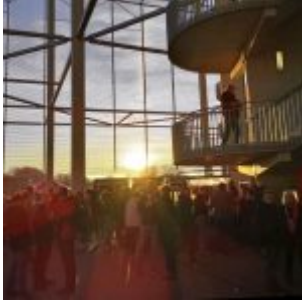
Spieltag in der Arena