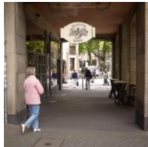
Em Kabüffke auf der Flinger Straße - Killepitsch direkt am Fenster