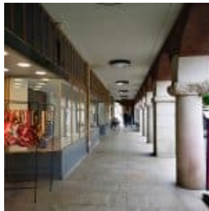
Arkaden der Alten Kämmerei