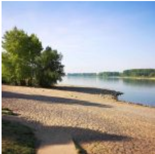
Rheinstrand bei Lörrick