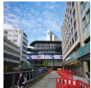
Blick zum Kö-Bogen II