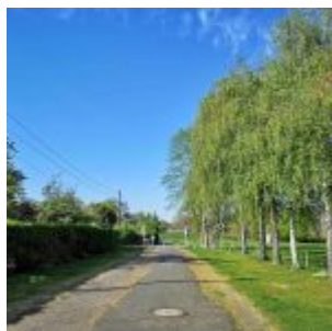
Weg zum Inigolf-Platz bei Niederkassel