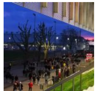
Spieltag in der Arena