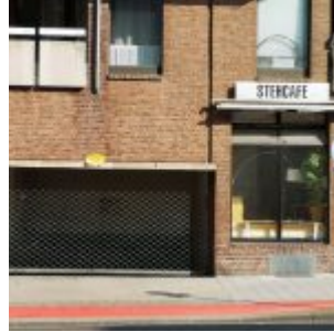
Stehcafe, Oberbilker Allee