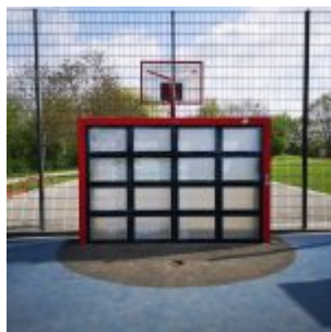
Elektronik auf dem Spielplatz im Nachbarschaftspark