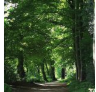
Weg im Aaper Wald