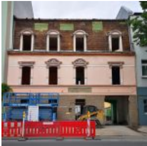
Abriss an der Oberbilker Allee