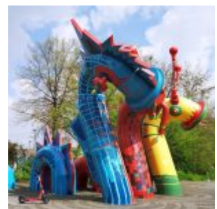
Nessi am Hennekamp