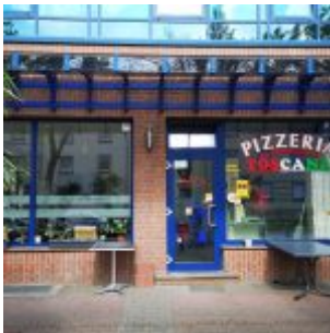
Izzeria Toscana auf der Posener Straße