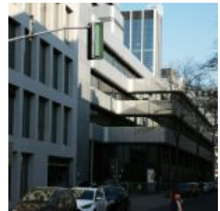
Es-WestLB an der Talstraße