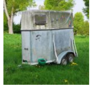
Pferdetransporter bei Lörick