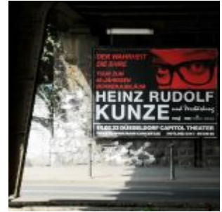
Horror in der Unterführung