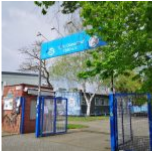
TuRU-Platz am Hennekamp