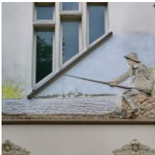
Am alten Fischerhaus in Urdenbach