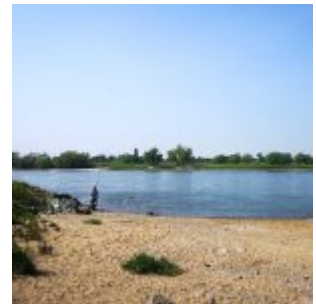
Angler bei Lohausen