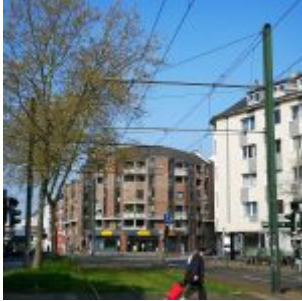
Ecke Hüttenstraße / Oberbilker Allee