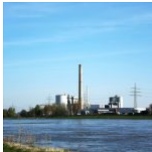
Gegenüber Kraftwerk Lausward