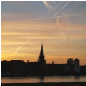
Altstadt im Morgendunst