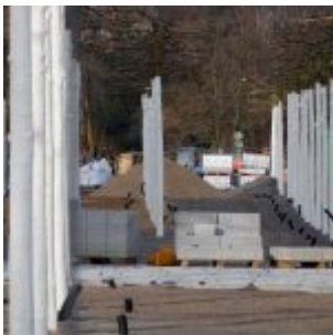
Neue Allee zwischen Kö-Bogen und Dreischeibenhochhaus