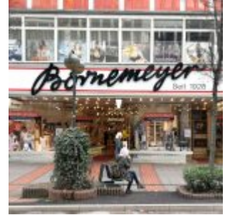
Bornemeyer auf der Schadowstraße