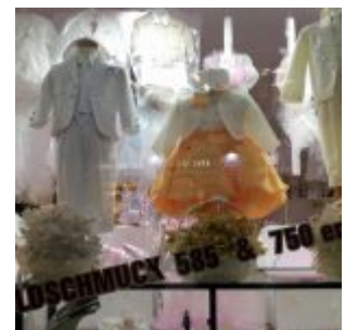
Big Greek Wedding