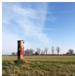
Ein Rohr auf dem Deich