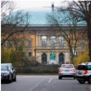
Durch die Hohestraße zum Ständehaus