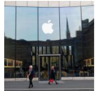
Der Apple-Store am Kö-Bogen