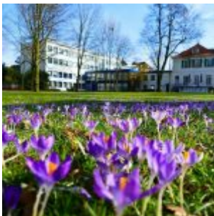
Frühling in Erkrath