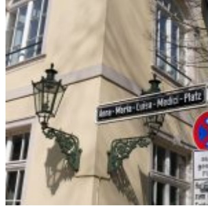
Am Anna-Maria-Luisa-Medici- Platz