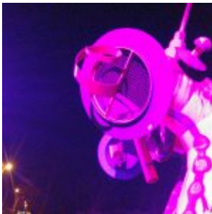
Nessi in Pink