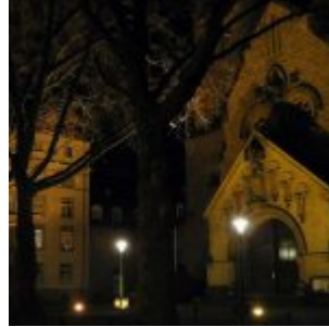
St. Antonius bei Nacht