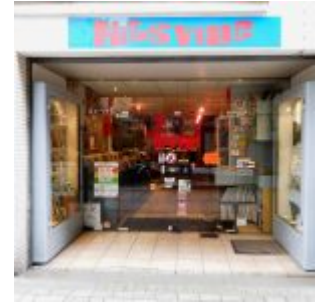
Hitsville, der Plattenladen