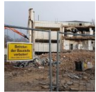
Abriss des Gartenhallenbades Oberkassel