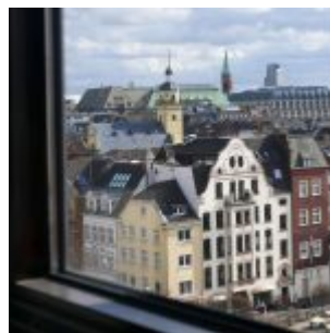
Über den Altstadtächern