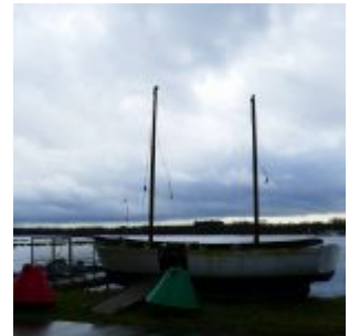
Am Unterbacher See