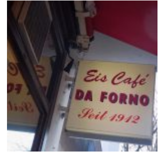
Die älteste Eisdiele der Stadt