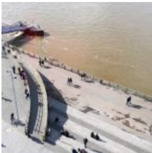
Untere Rheinwerft, gesehen aus der Laterne im Schlossturm

Auf der Facebook-Seite von The Düsseldorfer veröffentlichen wir jeden Tag ein Bild aus Düsseldorf. Und weil so viele Leserinnen und Leser diese Fotos mögen, sammeln wir die Bilder eines Monats und veröffentlichen sie noch einmal hier als Album. Dies sind die Bilder aus dem März 2017.