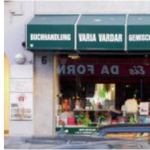
Verschiedenes auf der Schwerinstraße