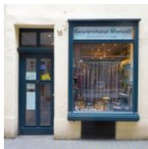
Das Gewürzhaus jetzt in der Kapuzinergasse