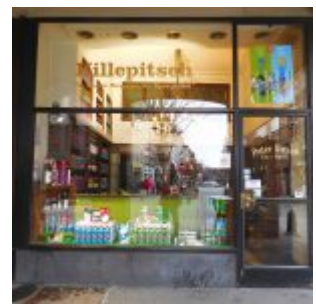
Die Quelle für den guten Killepitsch