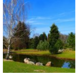
Frühling im Botanischen Garten