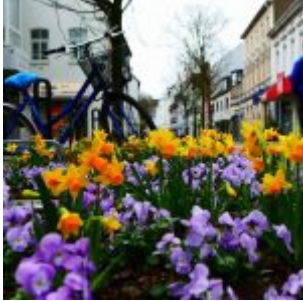
Frühling in Erkrath