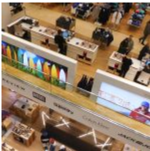
Bei Peek & Cloppenburg