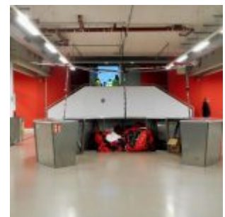
In der Arena während eines Heimspiels