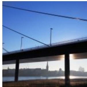
An der Brücke