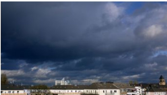
Wolken über Oberbilk