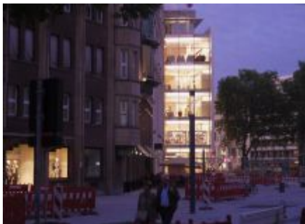
Peek & Cloppenburg