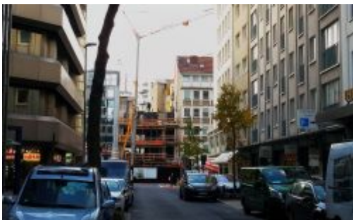
Neubau an der Friedrichstraße