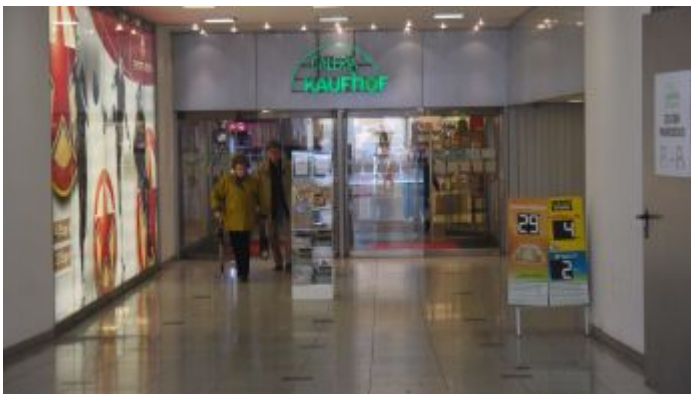
Kaufhof Galeria, Oststraße