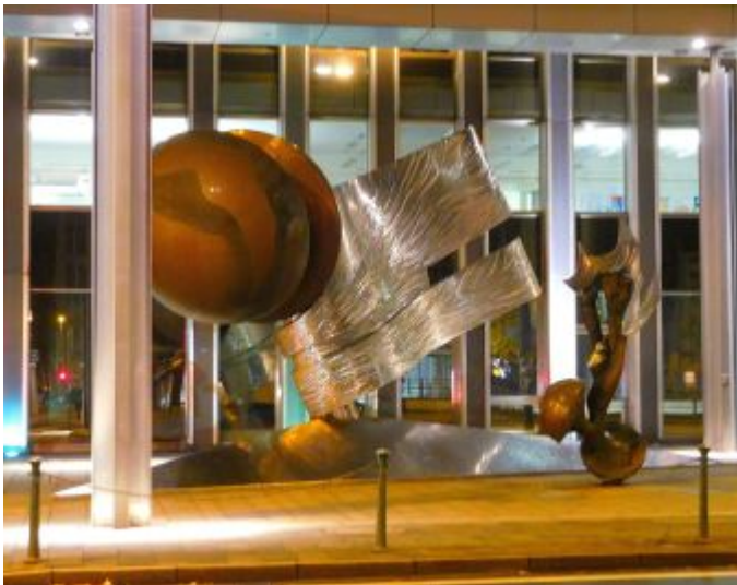
Kunst am Bau, Ex-WestLB am Kirchplatz