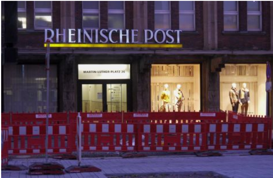
Rheinische Post in den Schadow-Arkaden