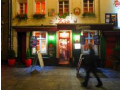
Der ewige Czikos