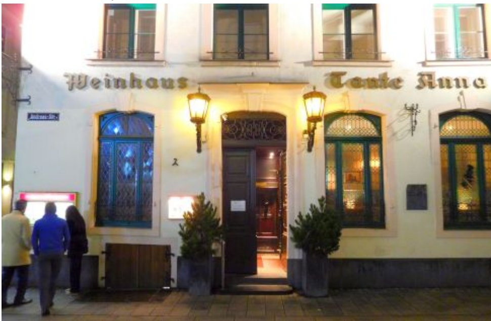
Weinhaus Tante Anna