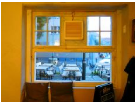
Im Bilker Häzz