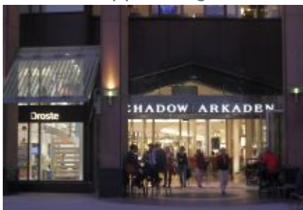
Schadow-Arkaden an einem Spätsommerabend