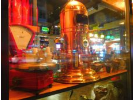
„Taucherglocke“ (Espresso Perfetto)