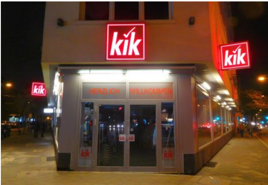
kík-Filiale an der Oberbilker Allee