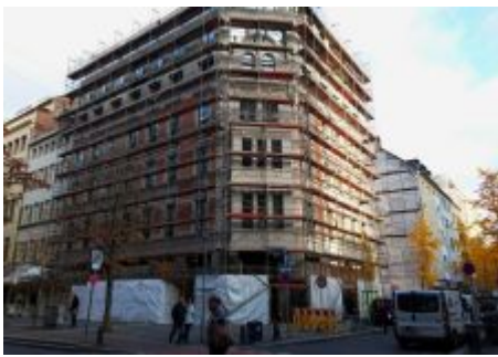
Endlich wieder sichtbar!