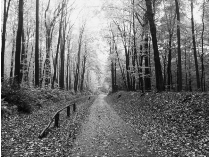
Im Aaper Wald