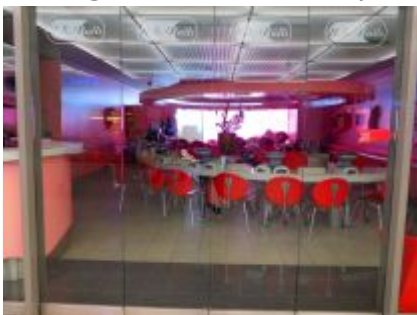
US-Nails im U-Bahnhof Heinrich-Heine-Allee