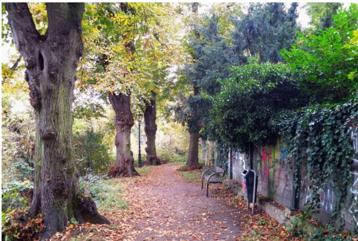
Barbarossawall in Kaiserswerth

Auf der Facebook-Seite von The Düsseldorfer veröffentlichen wir jeden Tag ein Bild aus Düsseldorf. Und weil so viele Leserinnen und Leser diese Fotos mögen, sammeln wir die Bilder eines Monats und veröffentlichen sie noch einmal hier als Album. Dies sind die Bilder aus dem November 2016.