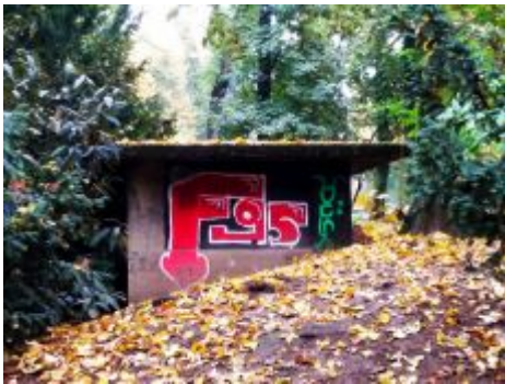
F95-Bunker am Alten Bilker Friedhof