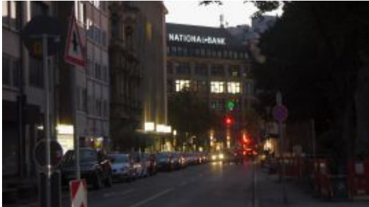
Nationalbank, gesehen durch die Josephinenstraße