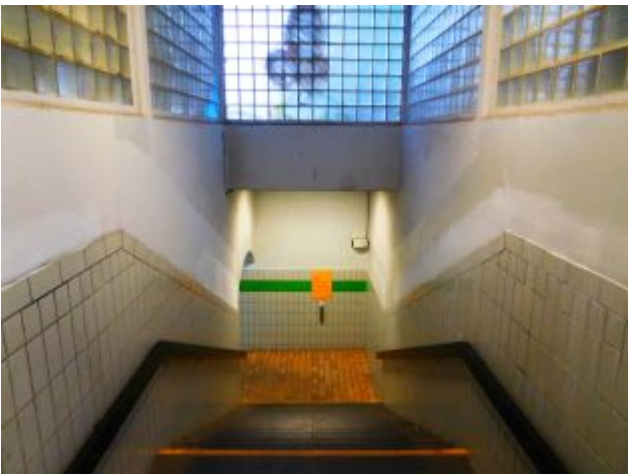
Treppe im Bahnhof Gerresheim