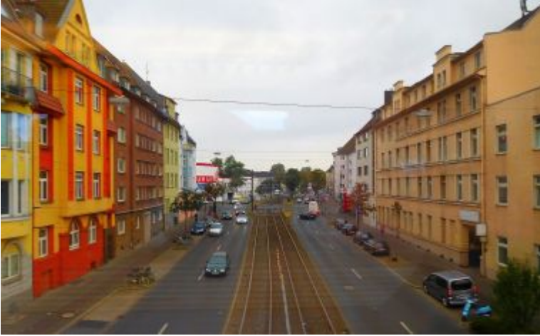
Kettwiger Straße, gesehen aus der S8