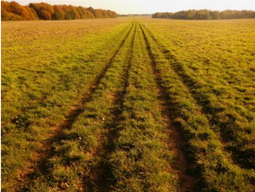
Segelflugwiese am Aaper Wald