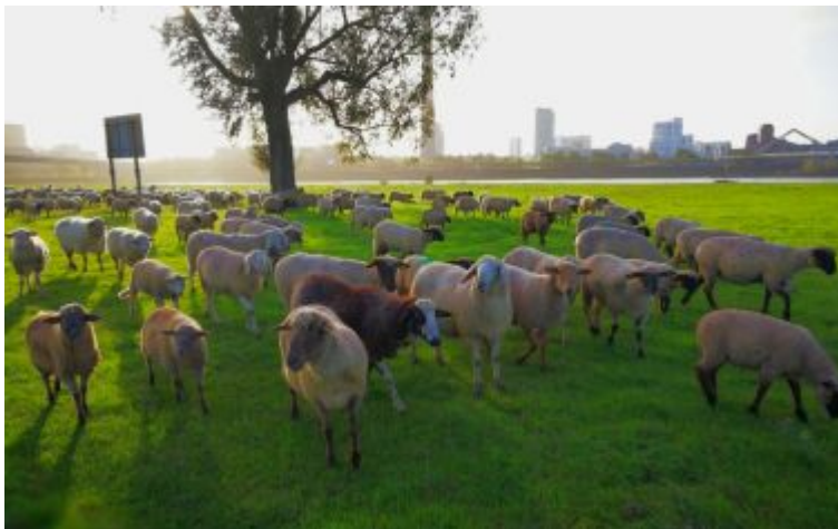
Schafe auf der Heerdter Rheinwiese