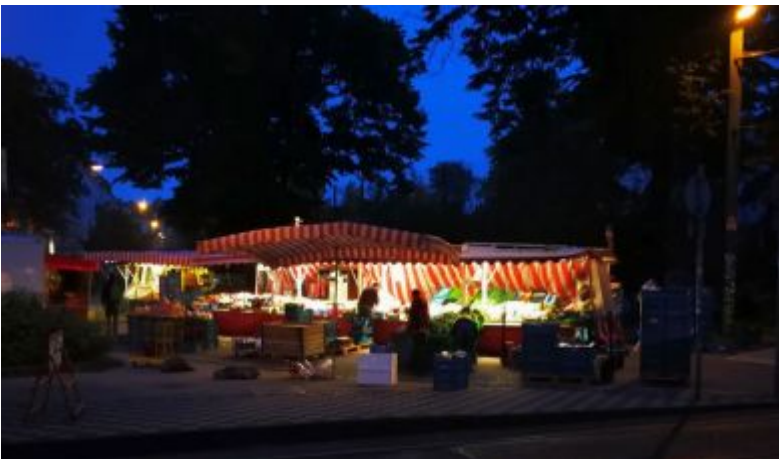
Poot, Wochenmarkt am Fürstenplatz