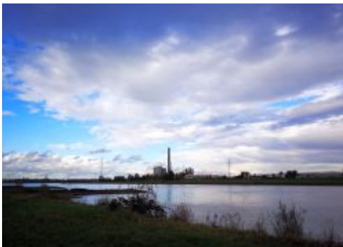
Der Himmel über dem Kraftwerk