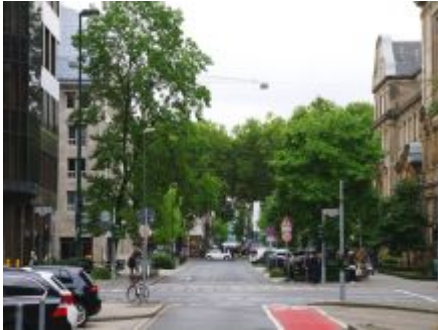
Bastionstraße Richtung Kö