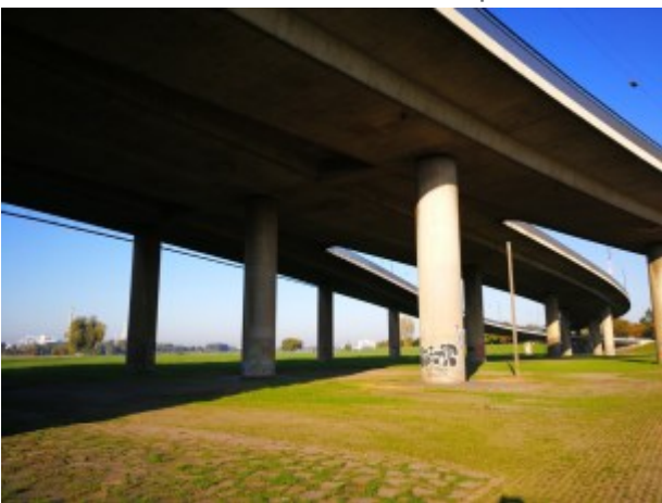
Unter der Kniebrücke