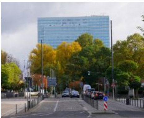
Dreischeibenhaus aus der Mühlenstraße gesehen