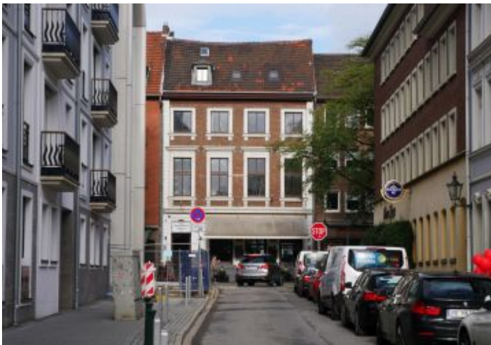
Zum Goldenen Einhorn aus der Neubrückestraße gesehen