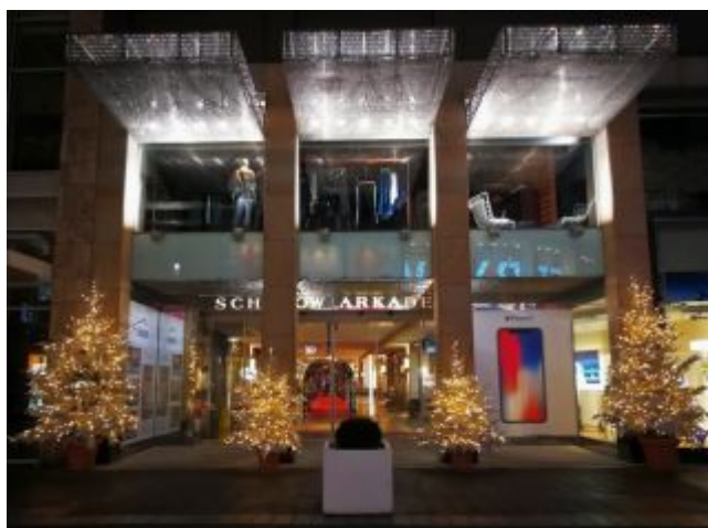
Schwadow-Arkaden bei Nacht

Auf der Facebook-Seite von The Düsseldorf veröffentlichten wir jeden Tag ein Bild aus Düsseldorf. Und weil so viele Leserinnen und Leser diese Fotos mögen, sammeln wir die Bilder eines Monats und veröffentlichen sie noch einmal hier als Album. Dies sind die Bilder aus dem November 2017.