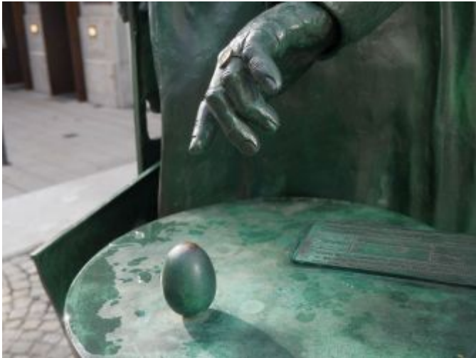
Mutter Ey ihre Hand