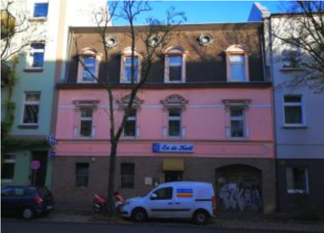
En de Kull, Oberbilker Allee