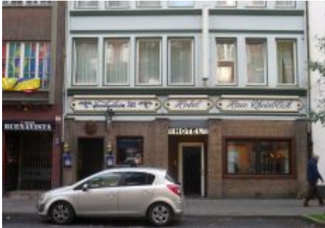
Hotel Rheinblick samt Julio