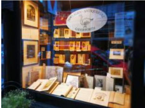
Ausverkauf im Antiquariat Ganseforth, Hohestraße