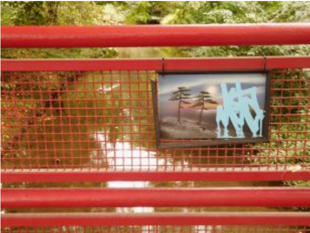
Kunst am Geländer, Karolingerstraße