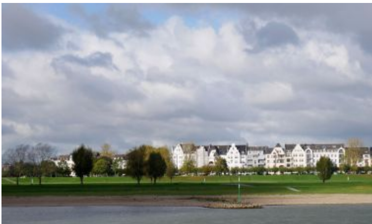
Der Himmel über Oberkassel