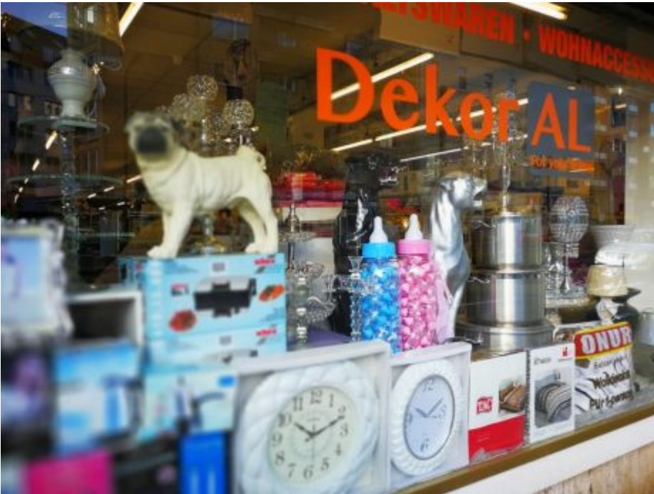
Dekoar Al, Corneliusstraße