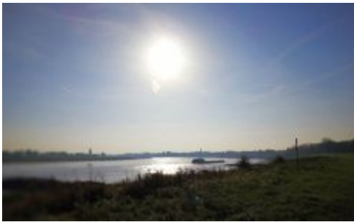
Der Rhein bei Grimmlinghause