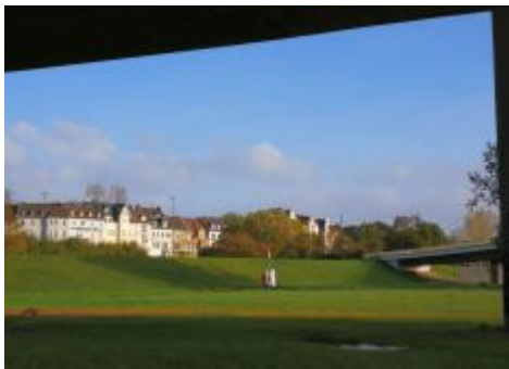
Blick zum Kaiser-Wilhelm-Ring