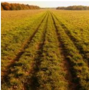
Segelflugwiese am Aaper Wald