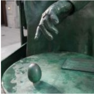
Mutter Ey ihre Hand