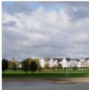
Der Himmel über Oberkassel