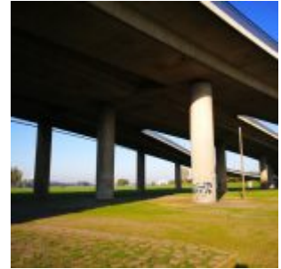
Unter der Kniebrücke