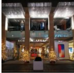
Schwadow-Arkaden bei Nacht

Auf der Facebook-Seite von The Düsseldorf veröffentlichen wir jeden Tag ein Bild aus Düsseldorf. Und weil so viele Leserinnen und Leser diese Fotos mögen, sammeln wir die Bilder eines Monats und veröffentlichen sie noch einmal hier als Album. Dies sind die Bilder aus dem November 2017.