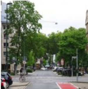
Bastionstraße Richtung Kö