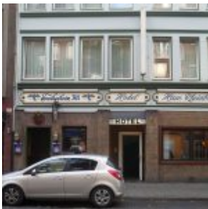
Hotel Rheinblick samt Julio