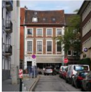
Zum Goldenen Einhorn aus der Neubrückstraße gesehen