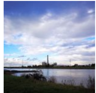
Der Himmel über dem Kraftwerk