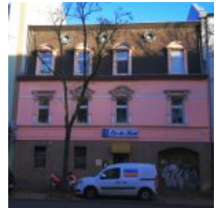
En de Kull, Oberbilker Allee