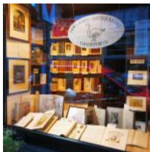
Ausverkauf im Antiquariat Ganseforth, Hohestraße