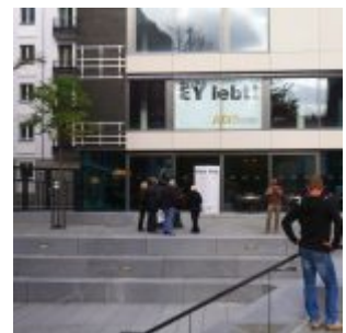
Ey am Andreasquartier