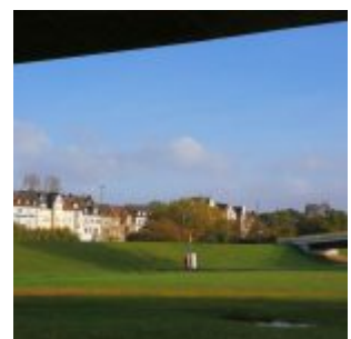
Blick zum Kaiser-Wilhelm-Ring