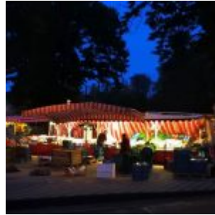
Poot, Wochenmarkt am Fürstenplatz