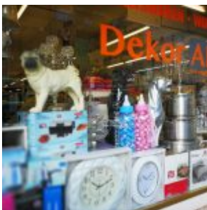
Dekoar Al, Corneliusstraße