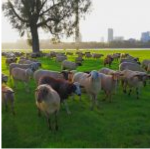
Schafe auf der Heerdter Rheinwiese