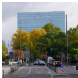
Dreischeibenhaus aus der Mühlenstraße gesehen