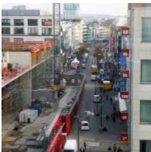
Blick in die Schadowstraße