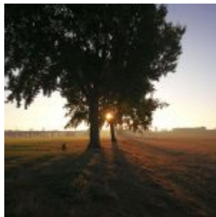
Sonntagmorgen am Rhein