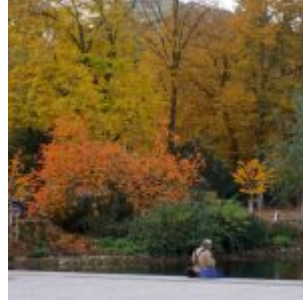
Fotograf im Herbst