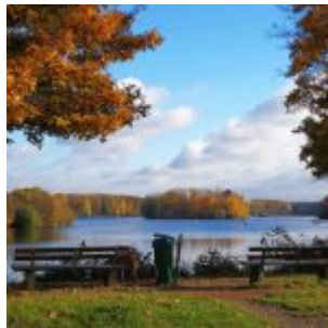
Optimistenbucht am Unterbacher See