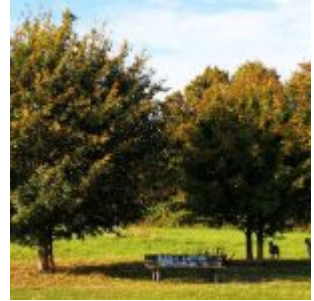
Eine Bank namens „Neuss“