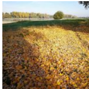
Der Herbst ist da