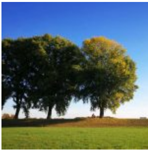
Bäume auf dem Deich