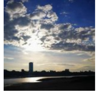
Panorama mit Wolken

Auf der Facebook-Seite von The Düsseldorfer veröffentlichen wir jeden Tag ein Bild aus Düsseldorf. Und weil so viele Leserinnen und Leser diese Fotos mögen, sammeln wir die Bilder eines Monats und veröffentlichen sie noch einmal hier als Album. Dies sind mit einiger Verspätung die wenigen Bilder aus dem November 2018.