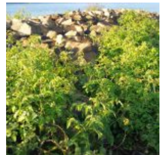
Tomatenfelder am Rhein