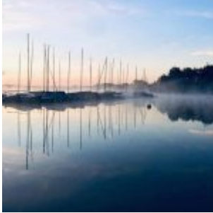
Morgens am Unterbacher See (Frank Hinz)