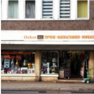
Schöne Deko muss nicht teuer sein