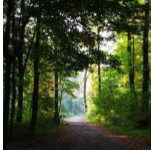
Im Eller Forst