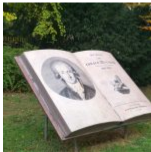
Goethe hinterm Schloss Jägerhof