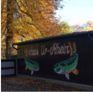
Haus Ur-Rhein am Unterbacher See