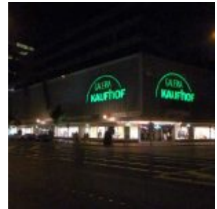
Galeria Kaufhof (2011)