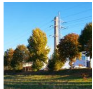
Auf der Lausward