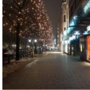
Weihnachtliche Kö (2013)