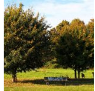
Eine Bank namens „Neuss“