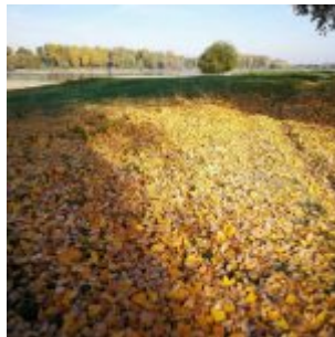
Der Herbst ist da