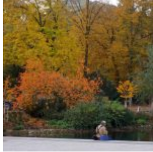
Fotograf im Herbst