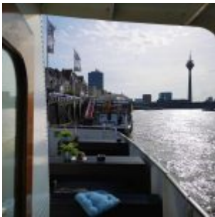
Auf der MS Düssel