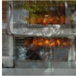
Grillhähnchen (Poularde, Münsterstraße)