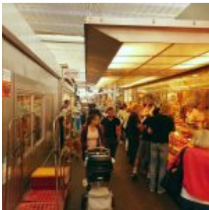
Schlösser auf dem Carlsplatz