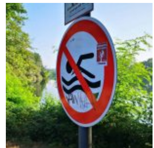
Schwimmen verboten (Sommer 2019)