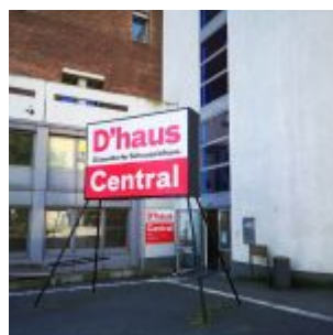
D'haus allein zuhaus