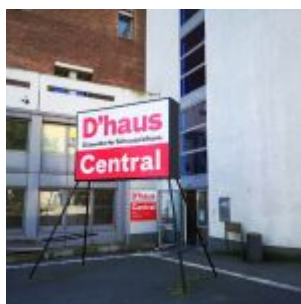
D'haus allein zuhaus