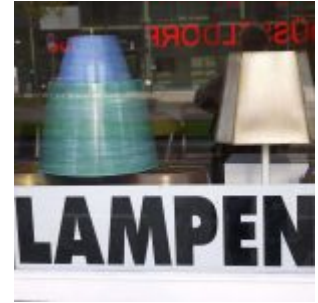
Lampenladen gegenüber HSD