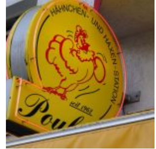
Poularde seit 1962