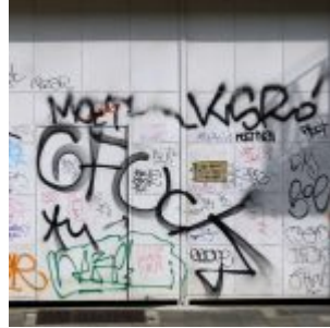
Tor an der Rather Straße