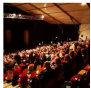
Im Zelt beim düsseldorf festival