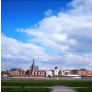
Der Himmel über der Stadt besteht aus lauter Düsseldorfer Luft, Luft, Luft...