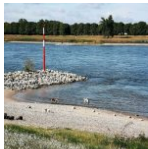
Vomerswerther Strand im Sommer 2019