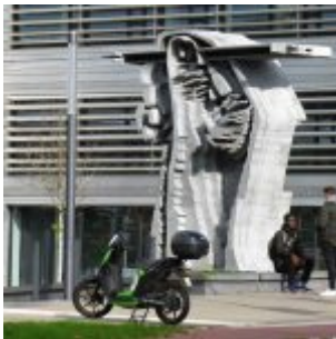
Hochschule Düsseldorf, Eingang Münsterstraße