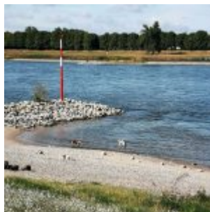
Vomerswerther Strand im Sommer 2019