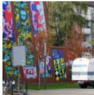
Wandbild an der HSD