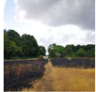
Verbrannte Wiese im Sommer 2019

[Anklicken zum Vergrößern] Auf der Facebook-Seite von The Düsseldorf veröffentlichten wir jeden Tag ein Bild aus Düsseldorf. Und weil so viele Leserinnen und Leser diese Fotos mögen, sammeln wir die Bilder eines Monats und veröffentlichen sie noch einmal hier als Album. Dies sind die Bilder aus dem November 2019.