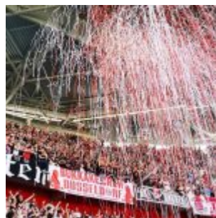
In der Südkurve