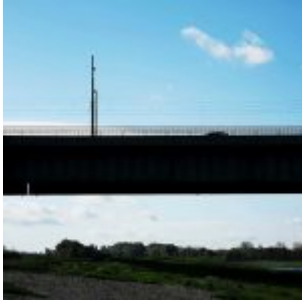
Über der Brücke