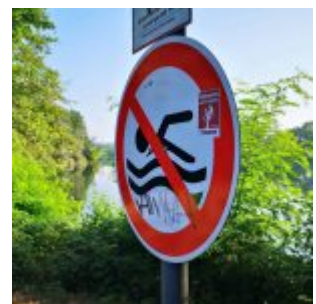
Schwimmen verboten (Sommer 2019)