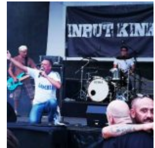
2019: Input Kinks bei Rock gegen Rechts