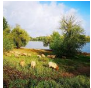
Schafidylle bei Lörick