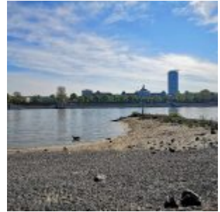
Rheinstrand bei Niedrigwasser