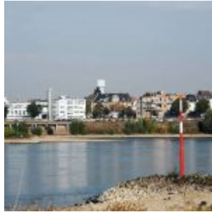
Das Südende von Heerdt