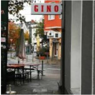
Da Gino am Fürstenplatz