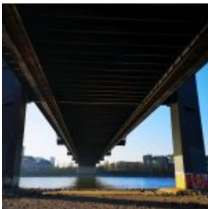
Kniebrücke von unten