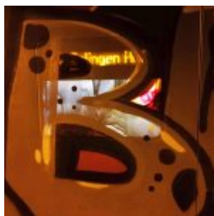
Dickes B auf der S-Bahn