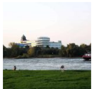
Blick rüber zum Medienhafen