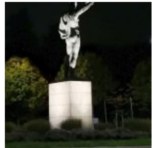
Der Blitzeschleuderer an der Arena