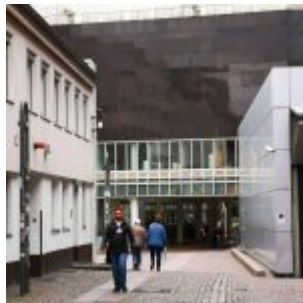
An der Ratinger Mauer