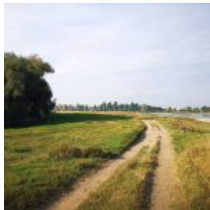
Auf der Lausward im Sommer