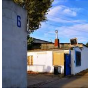
Am Fallhammer im Hafen