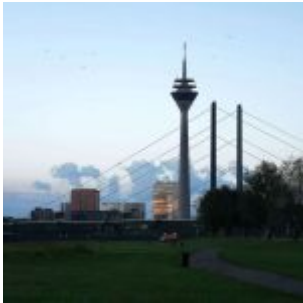
Brücke und Turm