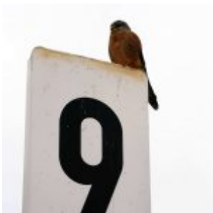
Falke Nr. 9