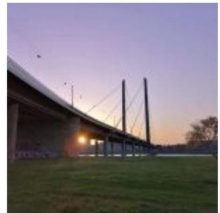
Sonnenaufgang unter der Kniebrücke