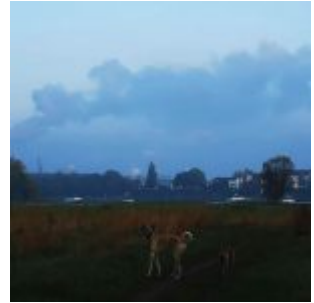
Blick zum Reisholzer Hafen