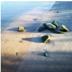
Steinstran am Rhein