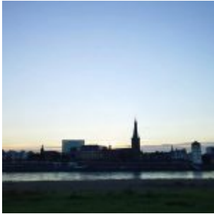
Morgen gegenüber der Altstadt