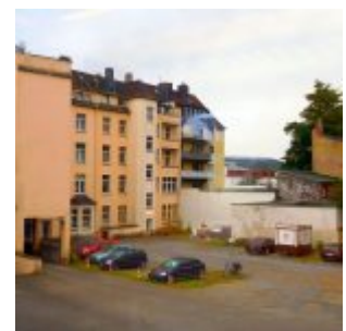
Gerresheimer Straße von hinten