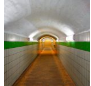
Durchgang am Bahnhof Gerresheim