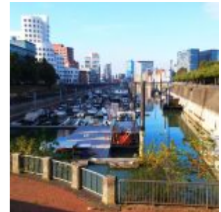
Marina im Medienhafen