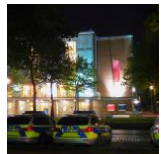
Gegenüber des „alten“ Opernhauses