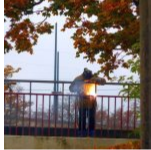
Passant im U-Bahnhof Heinrich- Kniebrückengeländerschweißer Heine-Allee