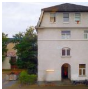
Gerresheimer Straße von hinten