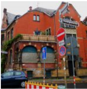
Das Spukhaus an der Heyestraße