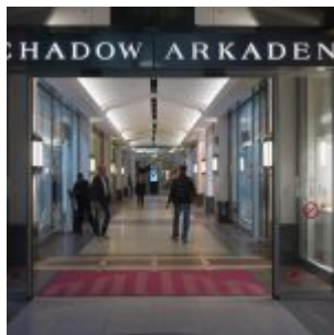
Schadow Arkaden, Blumenstraße