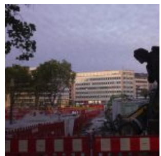
Blick über die Tuchtinsel