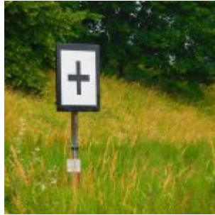
Das große Plus