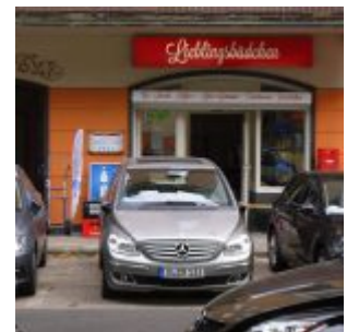
Lieblingsbüchchen am Frankenplatz