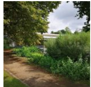
Kita im Volksgarten