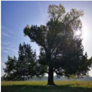
Baum bei Niederkassel