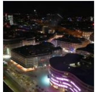
Schadowplatz von oben