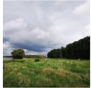
In der Urdenbacher Kämpe