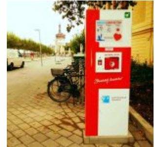
Defi an der Rheinuferpromenade