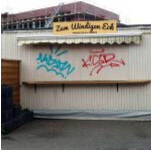
Zum Windigen Eck