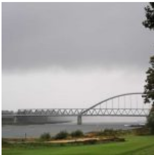
Regen an der Hammer Brücke