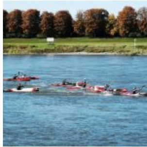
Kanuten bei Vomerswerth