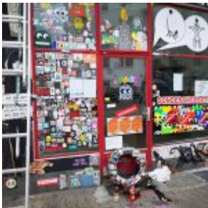
Brause zu für immer