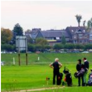
Golf auf der Lausward

[Anklicken zum Vergrößern] Auf der Facebook-Seite von The Düsseldorf veröffentlichten wir jeden Tag ein Bild aus Düsseldorf. Und weil so viele Leserinnen und Leser diese Fotos mögen, sammeln wir die Bilder eines Monats und veröffentlichen sie noch einmal hier als Album. Dies sind die Bilder aus dem Oktober 2019.