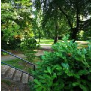
An der Barbarastraße