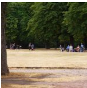
Frankenplatz im Hochsommer