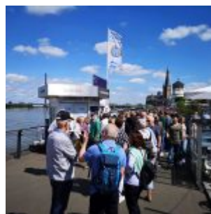
Andrang bei der Weissen Flotte