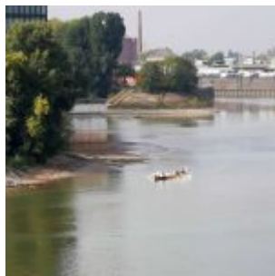
Ruderer im Hafen