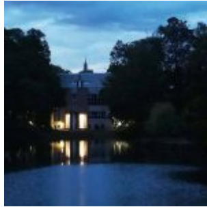
Stadtmuseum am Spee'schen Graben