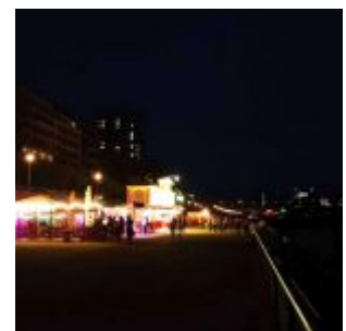
Buden auf dem Unteren Rheinwerft