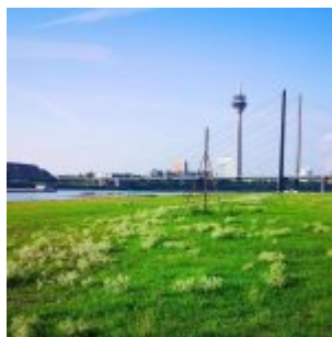
Rheinwiese mit Diesteln