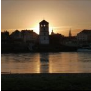
Schlosssturm am Morgen