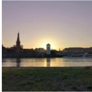
Altstadt am Morgen