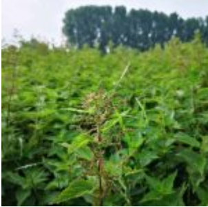
Kraut in der Urdenbacher Kämpe