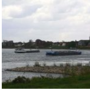
Schiffsverkehr auf dem Rhein