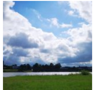
Wolken über Hamm