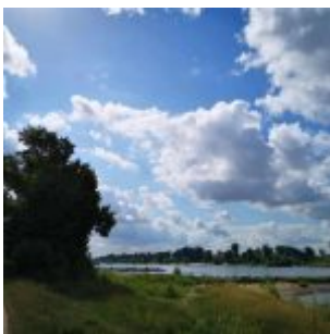
Wolken über Lörick