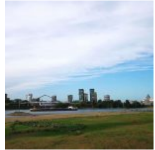
Blick zum Medienhafen