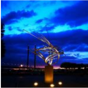
Kricke-Skulptur am Mannemann-Hochhaus