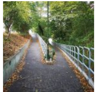
Fahrradrampe an der Südbrücke