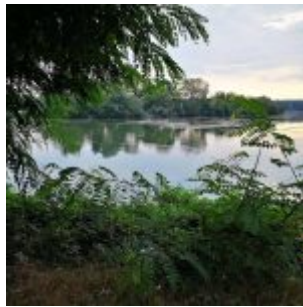
Optimistenbucht am Unterbacher See