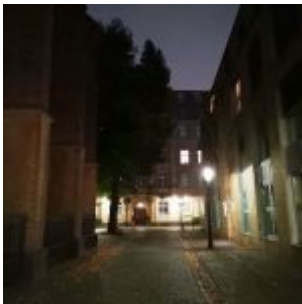
Stiftsplatz an St. Lambertus