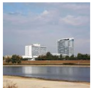
Hässlicher Neubau in Heerdt