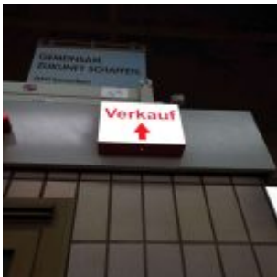
Auf dem Bahnsteig