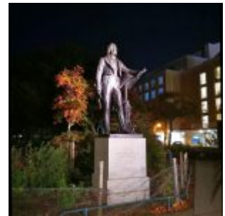
Felix Mendelssohn-Batholdy an der Oper