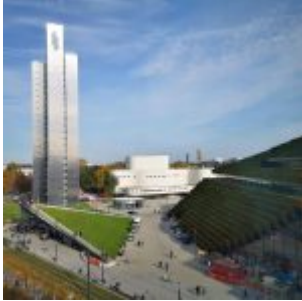
Blick auf den Kö-Bogen II