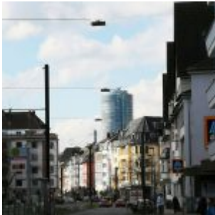
Münsterstraße Richtung Ergo

Im Instagram-Stream von The Düsseldorfer veröffentlichen wir jeden Tag ein Bild aus Düsseldorf. Und weil so viele Leserinnen und Leser diese Fotos mögen, sammeln wir die Bilder eines Monats und präsentieren sie noch einmal hier als Album. Dies sind die Bilder aus dem Oktober 2021.