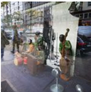
azz auf der Friedrich-Ebert- Straße