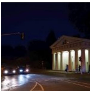
Rater Tor bei Nacht