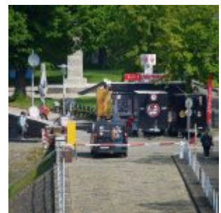
Blick aufs Fortuna-Büchchen