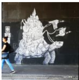
Mural in der Unteführung Corneliusstraße