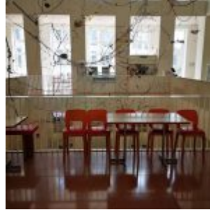
Café im Kunstpalast