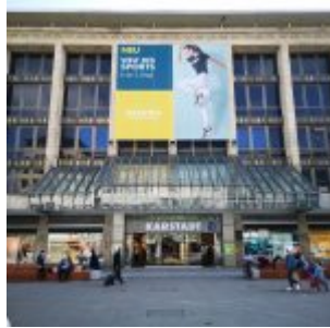
Karstadt an der Schadowstraße