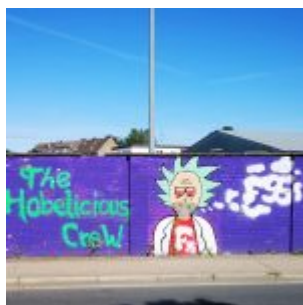
Hobelicious, Flinger Broich