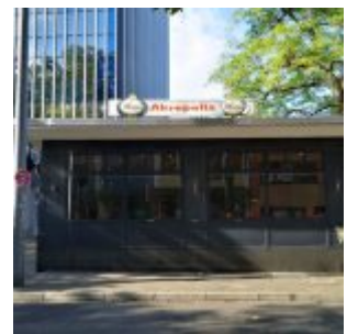
Restaurant Akropolis, Charlottenstraße