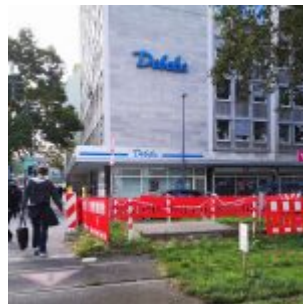
Eingang zum geheimem Tunnel, Immermannstraße