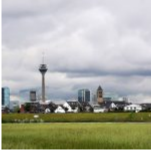
Gegenüber Hamm und Hafen