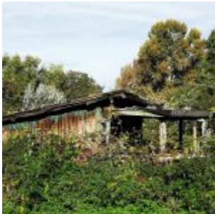
Laube im Kleingartengelände Niederkassel