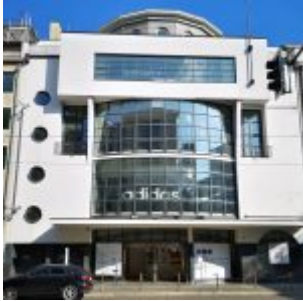
Karstadt Sports, Tonhallenstraße