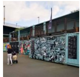
Stadtstrand an der Oberkasseler Brücke