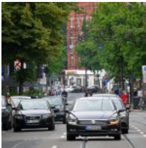
Blick in die Nordstraße