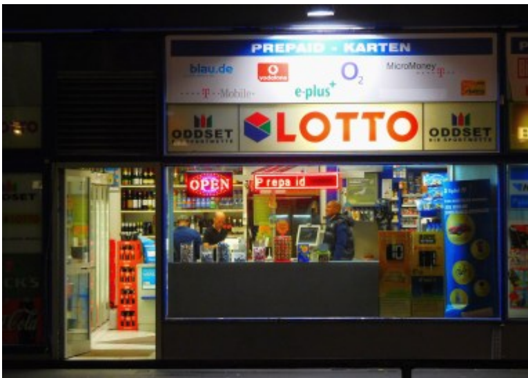
Prepaid am Bahnhof