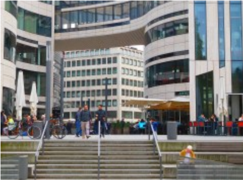
Durch den Kö-Bogen