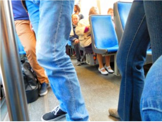
In der Bahn