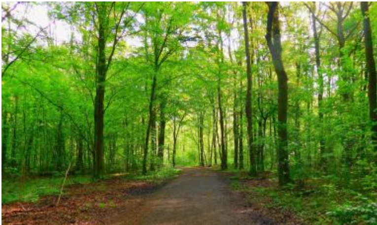
Im Eller Forst