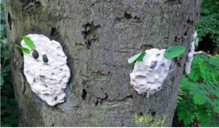
Baumgesichter im Grafenberger Wald