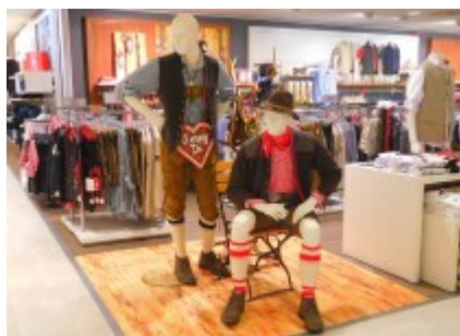
Für die Buam