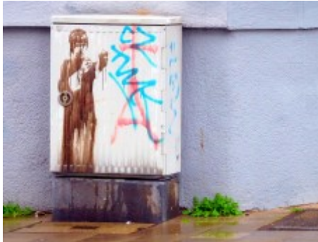
Kung-fu am Kasten