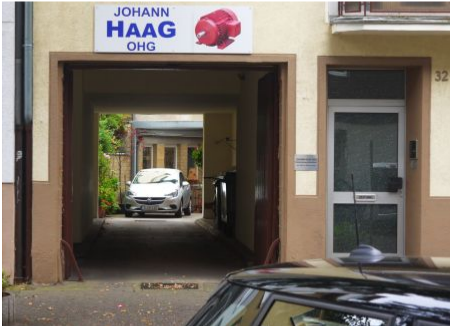
Elektromotoren Haag, Hildebrandtstraße