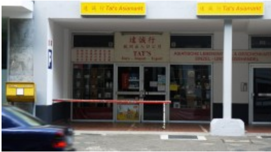
Tat's Asia-Markt, Fürstenwall