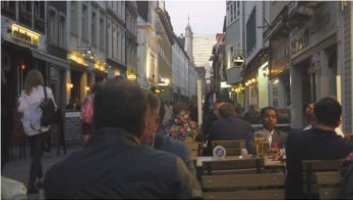
Spätsommer in der Kurzestraße