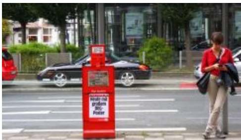
Express und Nicht-Leserin