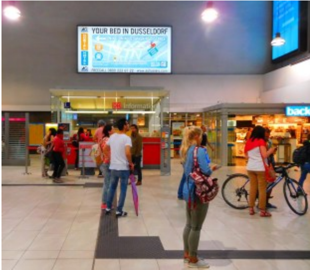
Infostand im Hbf