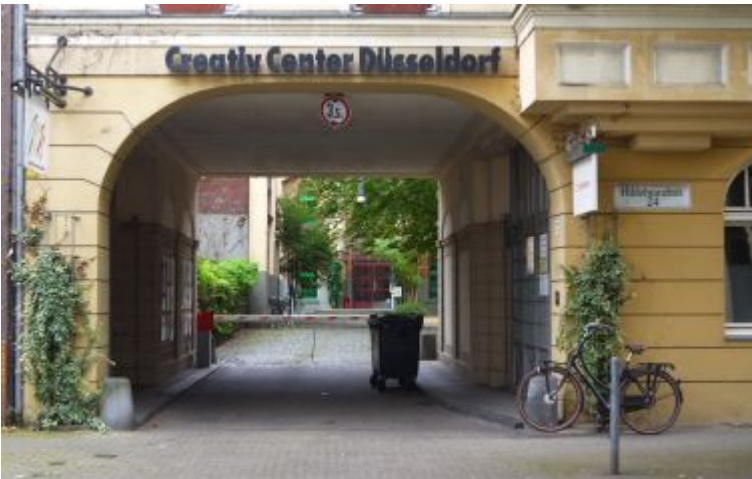
Creativ Center Düsseldorf, Hildebrandtstraße