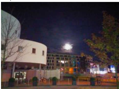
Mond überm Schauspielhaus