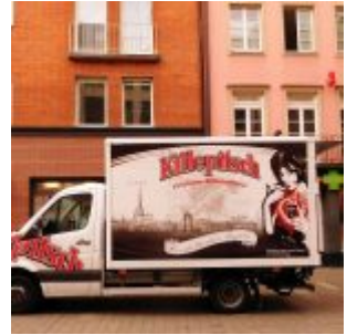
Immer stilsicher, immer schön: auch der Killepitsch-Lieferwagen