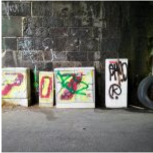
Kästen unter der Brücke