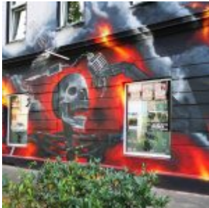
Graffiti am Pitcher