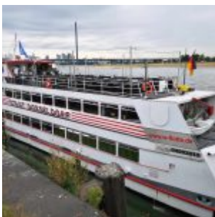
MS Stadt Düsseldorf