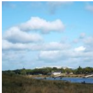
Blick auf die Wie-auch-immer-sie-gerade-heißen-mag-Arena