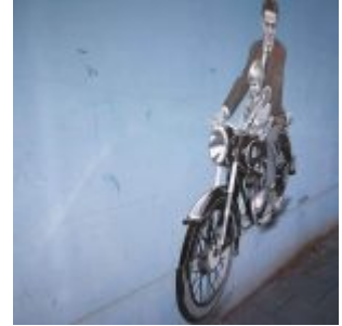
An der Va-Douven-Straße