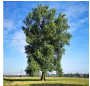
Baum auf der Rheinwiese