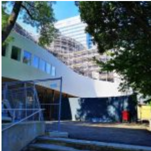
Schauspielhaus im Umbau