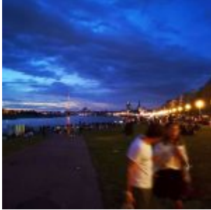
Unteres Rheinwerft am Abends