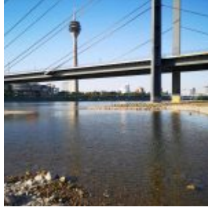
Und wieder die Brücke