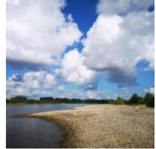
Wolken über dem Strom

Im Instagram-Stream von The Düsseldorfer veröffentlichen wir jeden Tag ein Bild aus Düsseldorf. Und weil so viele Leserinnen und Leser diese Fotos mögen, sammeln wir die Bilder eines Monats und veröffentlichen sie noch einmal hier als Album. Dies sind die Bilder aus dem September 2020.