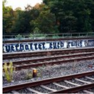
Verhaltet euch ruhig