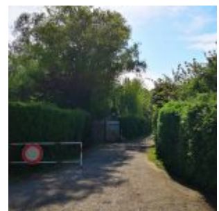
Zugang in Niederkassel