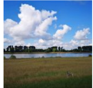
Auf der Lausward