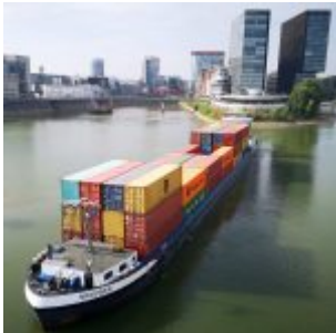
Ausfahrt aus dem Hafen