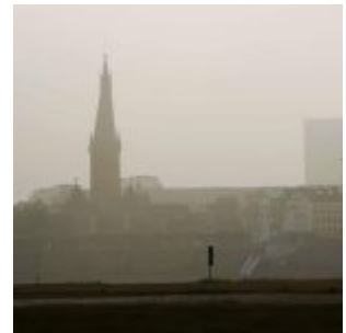
St. Lambertus im Dunst