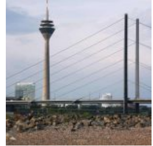
Und nochmal die Brücke