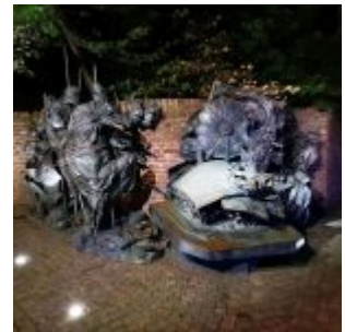
Das Stadterhebungsmonument von Bert Gerresheim am Rande des Burgplatzes