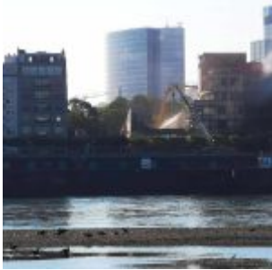
Abriss an der Rheinpromenade