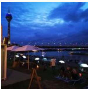
Stadtstrand am Abend