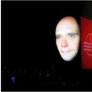
Faces auf dem Burgplatz