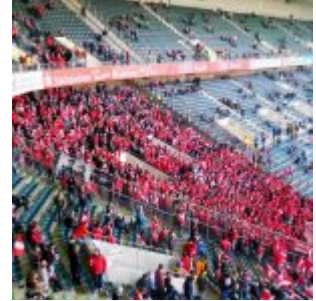
BMG vs F95: Der rote Keil