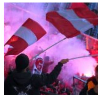
Pyro mit Fahnen