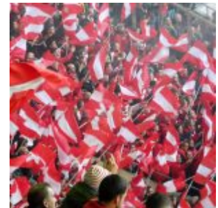
November 2018: Fähnchen

Muss man über diese Partie eigentlich irgendetwas Detailliertes schreiben? Reicht es nicht, die erste Halbzeit zu schildern und die verrückte Strafstoßentscheidung des durchgeknallten Schiris Brych? Ist es nicht sinnvoller, sich vorwiegend mit diesem Elfer zu befassen? Und sich zu fragen, wo eigentlich der Videoassi im Kölner Keller sich gerade rumgetrieben hat? Ist diese so kaputtgepiffene Partie nicht Grund genug, mal über die völlig bescheuerte Handspielregel zu diskutieren? Muss man eigentlich Verschwörungstheoretiker sein, wenn man behauptet, dass es eine solche Entscheidung gegen keinen der reichen, etablierten Vereine niemals gegeben hätte? Nicht gegen die Bayern, nicht gegen den BVB, Schalke, Gladbach oder dieses eklige Projekt. Nicht dass wir uns falsch verstehen: Natürlich hätte unsere geliebte Fortuna dieses schwere Auswärtsspiel verlieren können – aber wenn es so abläuft, macht es einfach keinen Spaß.