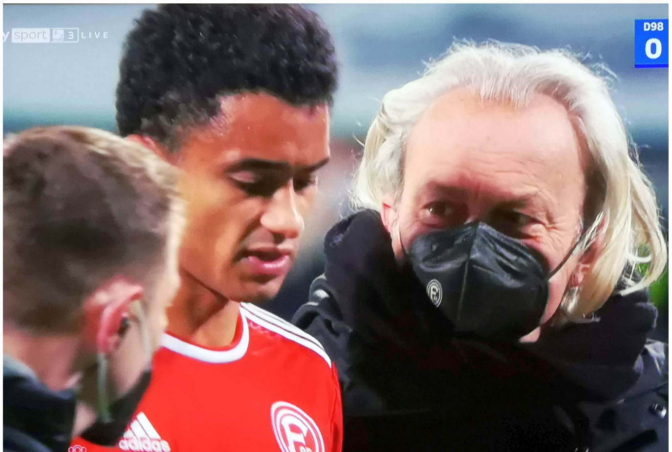
SVD vs F95: Auch Emma kriegte einen mit von der Kloppertuppe

Preußer und Kleine hatten also ein 3-5-2 serviert. Und davon profitierten fast alle Akteure in Rot. Zum Beispiel Cello Sobottka, der als defensiver Sechser das Spiel ordnete wie er es schon sehr, sehr lange nicht mehr getan hat. Von dessen klaren Position profitierte wiederum Kuba Piotrowski, der endlich einen echten - wie sagt man auf modern? - Box-to-Box-Kicker geben konnte. Nur so kam er in die Lage mit einem zuckersüßen Steckpass auf Cello das Tor zum 1:0 einzuleiten.