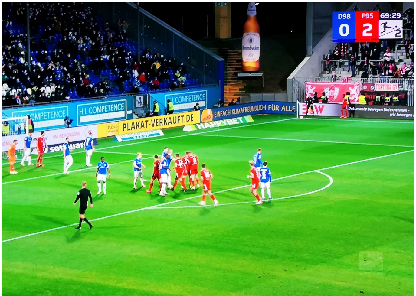
SVD vs F95: Ab und an ein wenig Entlastung in der zweiten Hälfte