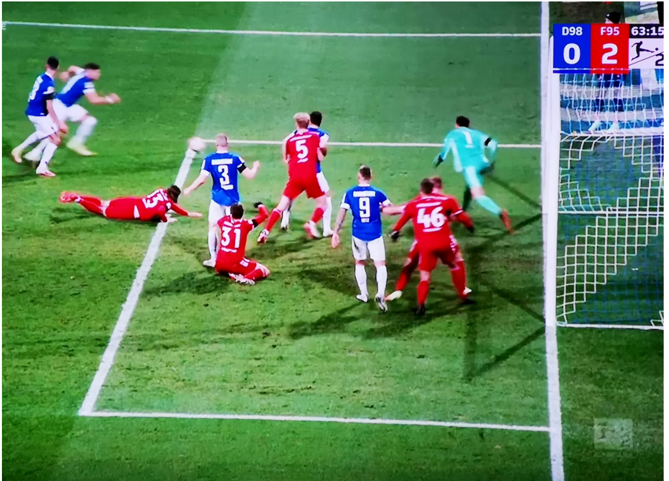
SVD vs F95: Da brennt es heftig im Fortuna-Strafraum