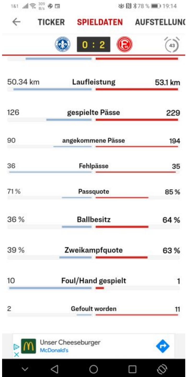
SVD vs F95: Wunderbare Halbzeitwerte für unsere Jungs

Von Minute zu Minute wechselte das ... Dings, äh, Momentum. Die Düsseldorfer lösten trotz