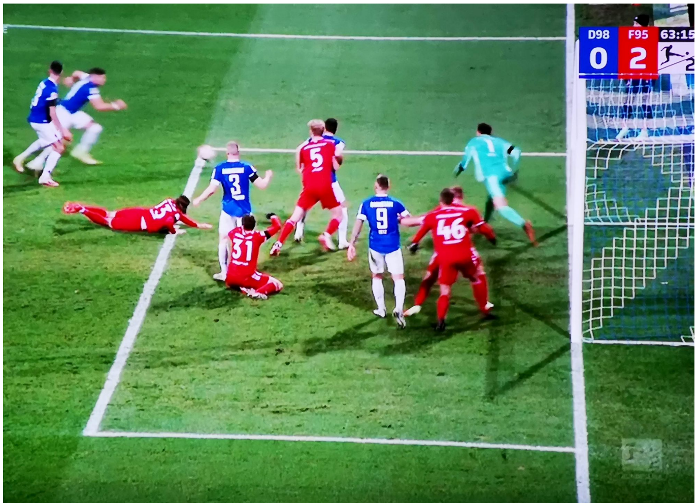
SVD vs F95: Da brennt es heftig im Fortuna-Strafraum