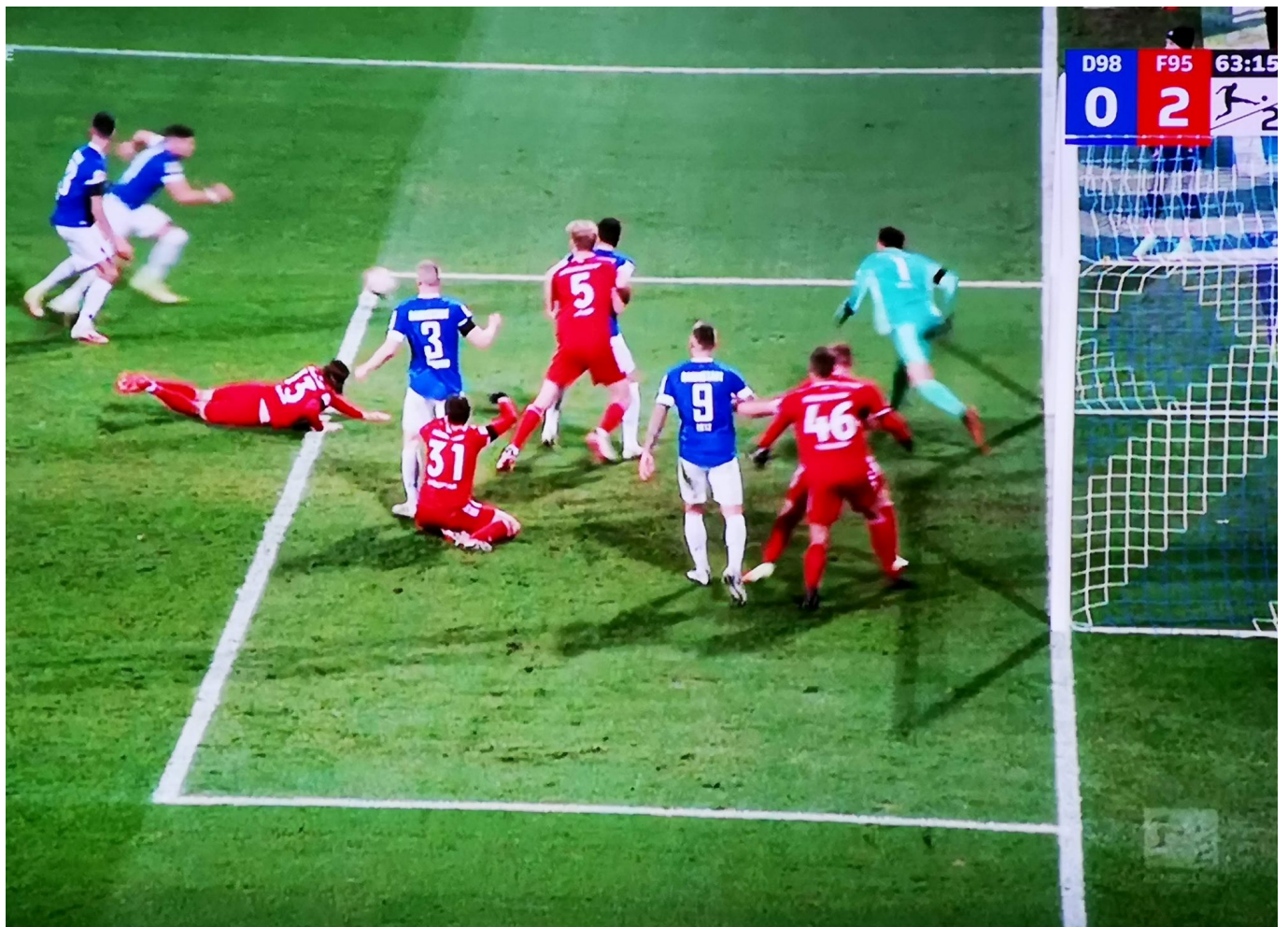
SVD vs F95: Da brennt es heftig im Fortuna-Strafraum

Mit seiner Kurzanalyse auf Sky lag Preußner aber sowas von richtig: Waren seine Jungs in der ersten Halbzeit spielerisch überlegen, hielten sie ihren Vorsprung in der zweiten Hälfte durch eine starke kämpferische Leistung. Hey, das geht raus an euch Wutfans, Uwe-Klein-Hater, Preußner-Basher, Alles-schlecht-Redenden, aber auch an euch Betonpessimisten, Zweifler und Skeptiker – gestern haben die Spieler, die Trainer und auch die Verantwortlichen gezeigt, was prinzipiell in der aktuellen Konstellation möglich ist. Das Bekenntnis von Klaus Allofs zu Preußner vor dem Spiel auf Sky war keines dieser Alibi-Statements, sondern ausgesprochen überzeugend. Und, nein, Ihr hörschd Ergebener glaubt nicht, dass der Trainer nach einer Niederlage in Darmstadt geschasst worden wäre.