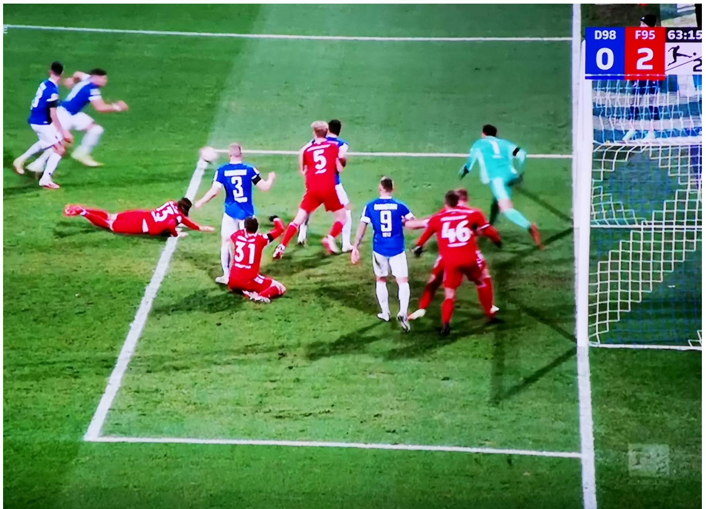
SVD vs F95: Da brennt es heftig im Fortuna-Strafraum