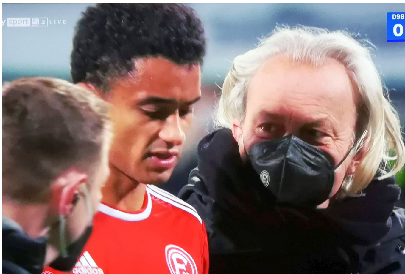
SVD vs F95: Auch Emma kriegte einen mit von der Kloppertuppe

Preußer und Kleine hatten also ein 3-5-2 serviert. Und davon profitierten fast alle Akteure in Rot. Zum Beispiel Cello Sobottka, der als defensiver Sechser das Spiel ordnete wie er es schon sehr, sehr lange nicht mehr getan hat. Von dessen klaren Position profitierte wiederum Kuba Piotrowski, der endlich einen echten - wie sagt man auf modern? - Box-to-Box-Kicker geben konnte. Nur so kam er in die Lage mit einem zuckersüßen Steckpass auf Cello das Tor zum 1:0 einzuleiten.