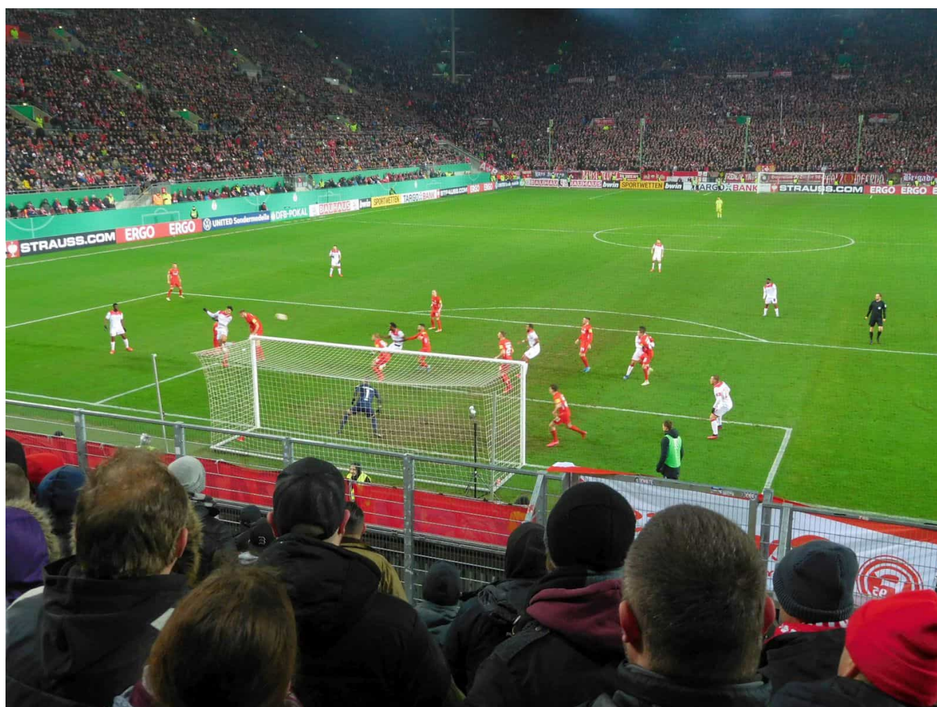
Morales auf Nana – gegen K'lautern im Pokal (2020) – vielleicht Ampomahs bestes Spiel für die Fortuna