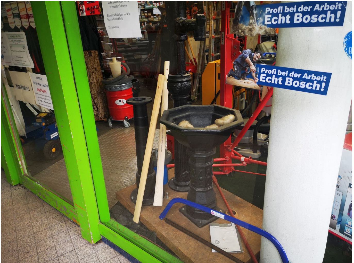
Durch Türe kómen sie alle, die Deltvos-Kunden

das passende Material zur Maschine, also Bohrspitzen, Trennscheiben, Ketten etc.