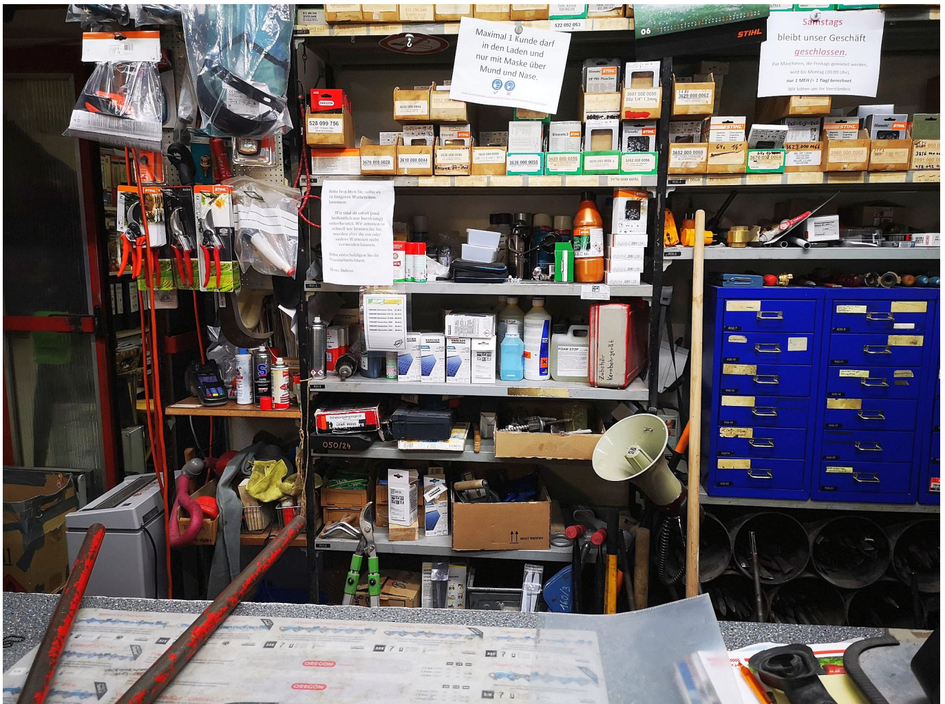
Hinterm Delvos-Tresen – nur für Eingeweihte

doch: Einfach dem Chef GANZ GENAU sagen, was das ist, was man braucht, und wie man es nennt. Wetten, dass es die gewünschte Gerätschaft binnen Wochenfrist in den Katalog geschafft hat?