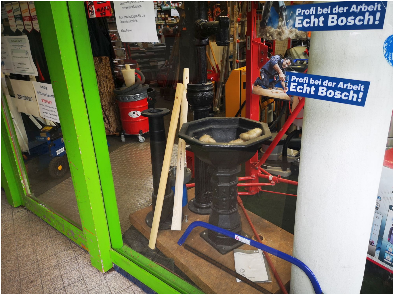
Durch Türe kómen sie alle, die Deltvos-Kunden

das passende Material zur Maschine, also Bohrspitzen, Trennscheiben, Ketten etc.