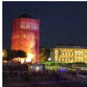
Drüben auf dem Burgplatz