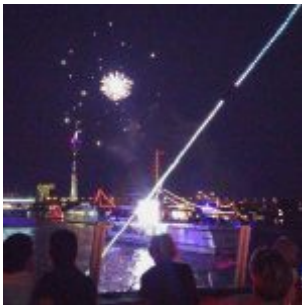
Vom Bug aus