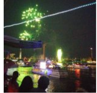
Das Feuerwerk beginnt