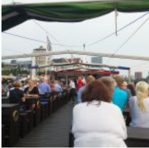
Auf dem Oberdeck