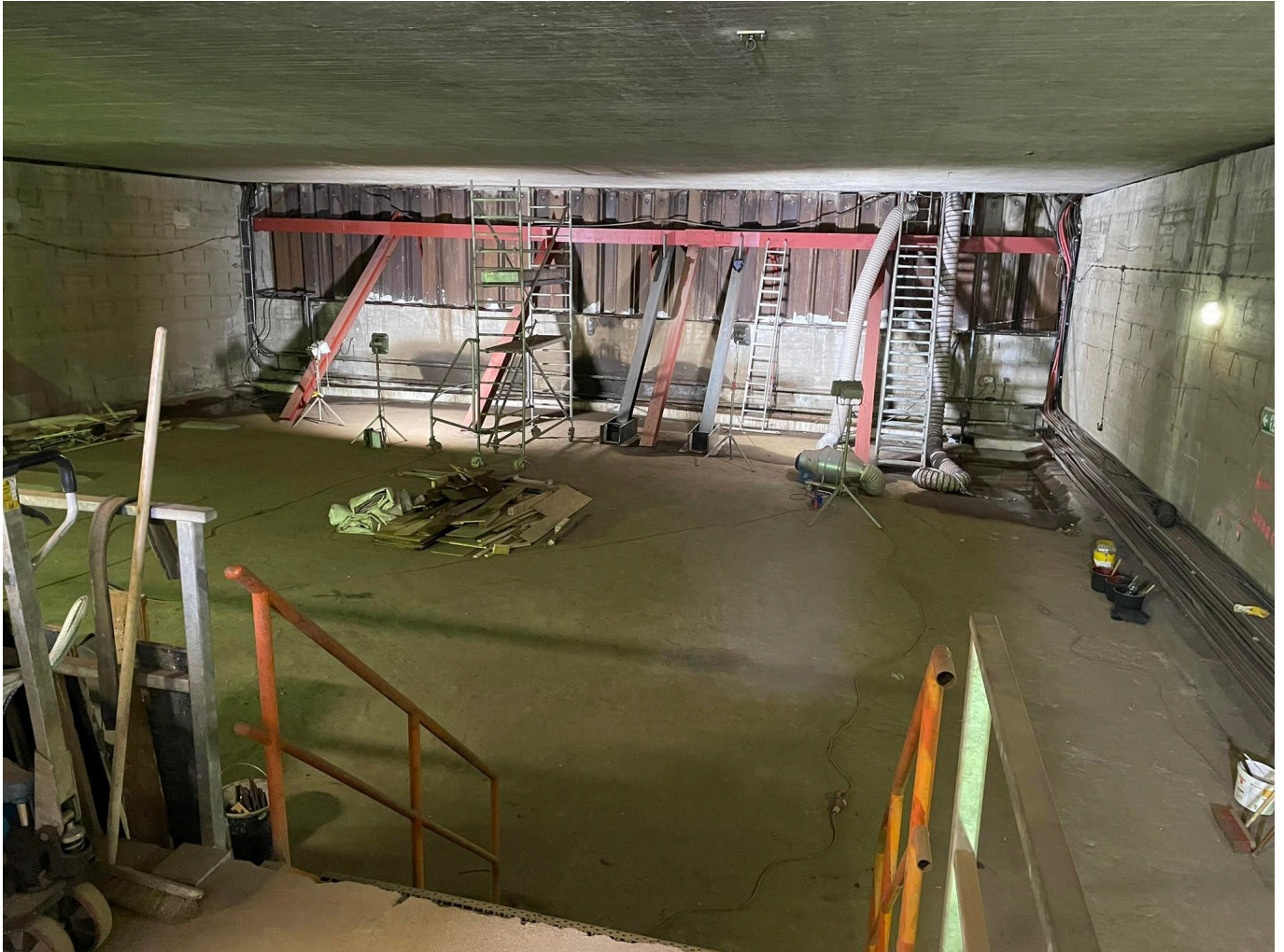
Im geheimen Tunnel unter der Immermannstraße

Genau so schilderte ich es, als ich mich am 13. Oktober mit Hamzi am WDR-Funkhaus am Medienhafen traf. Was er denn rausgekriegt habe, fragte ich. Aber er wollte damit nicht rausrücken bis ich meine Version in die Kamera gesprochen hatte. So geschah es. Als wir fertig waren, sagte Hamzi, er habe Kontakt mit dem Bauamt der Stadt gehabt, und sie könnten am Nachmittag im Tunnel drehen. Der sei keineswegs ein Relikt der geplanten Unterpflasterbahn, sondern Teil eines möglichen Straßentunnels! Der war gedacht als Verbindung von der östlichen Abfahrt des Tausendfüßlers unter dem Hauptbahnhof hindurch Richtung Oberbilker Markt.