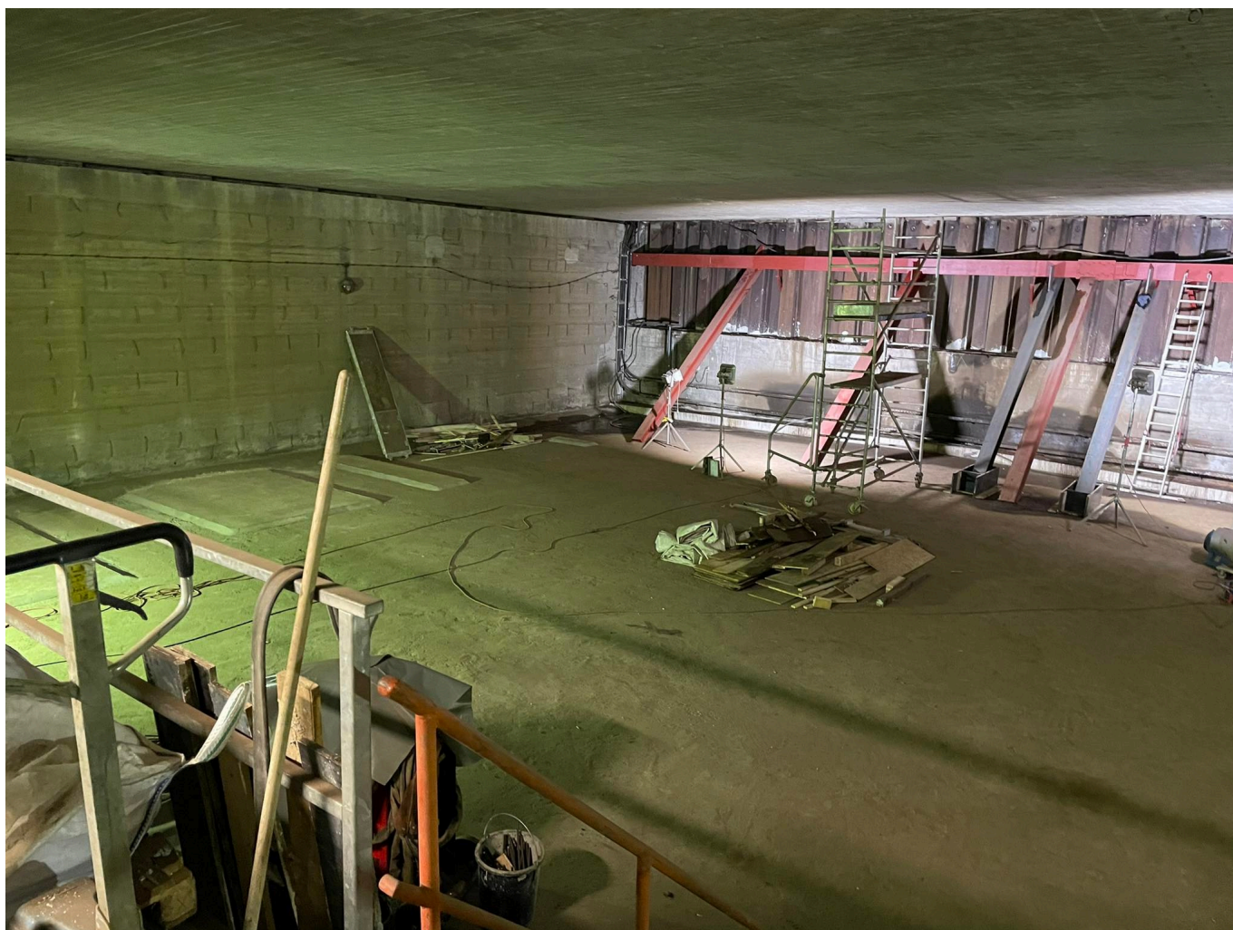
Im geheimen Tunnel unter der Immermannstraße

Nach nun fast 40 Jahren recherchierte ich, um was es sich handeln könnte und stieß auf diverse Dokumente, die davon sprachen, dass die Stadt schon zu Beginn der Sechzigerjahre eine Unterpflasterbahn hatte bauen wollen. Außerdem fand ich einen Netzplan, der die projektierten Linien zeigte - eine davon sollte vom Hauptbahnhof in Richtung Pempelfort abzweigen. Ich reimte mir das so zusammen, dass man zu Testzwecken ein Stück unterirdischer Strecke angelegt hatte. Dass die Pläne für eine Unterpflasterbahn zugunsten der späteren U-Bahn verworfen hat, war mir auch bekannt.