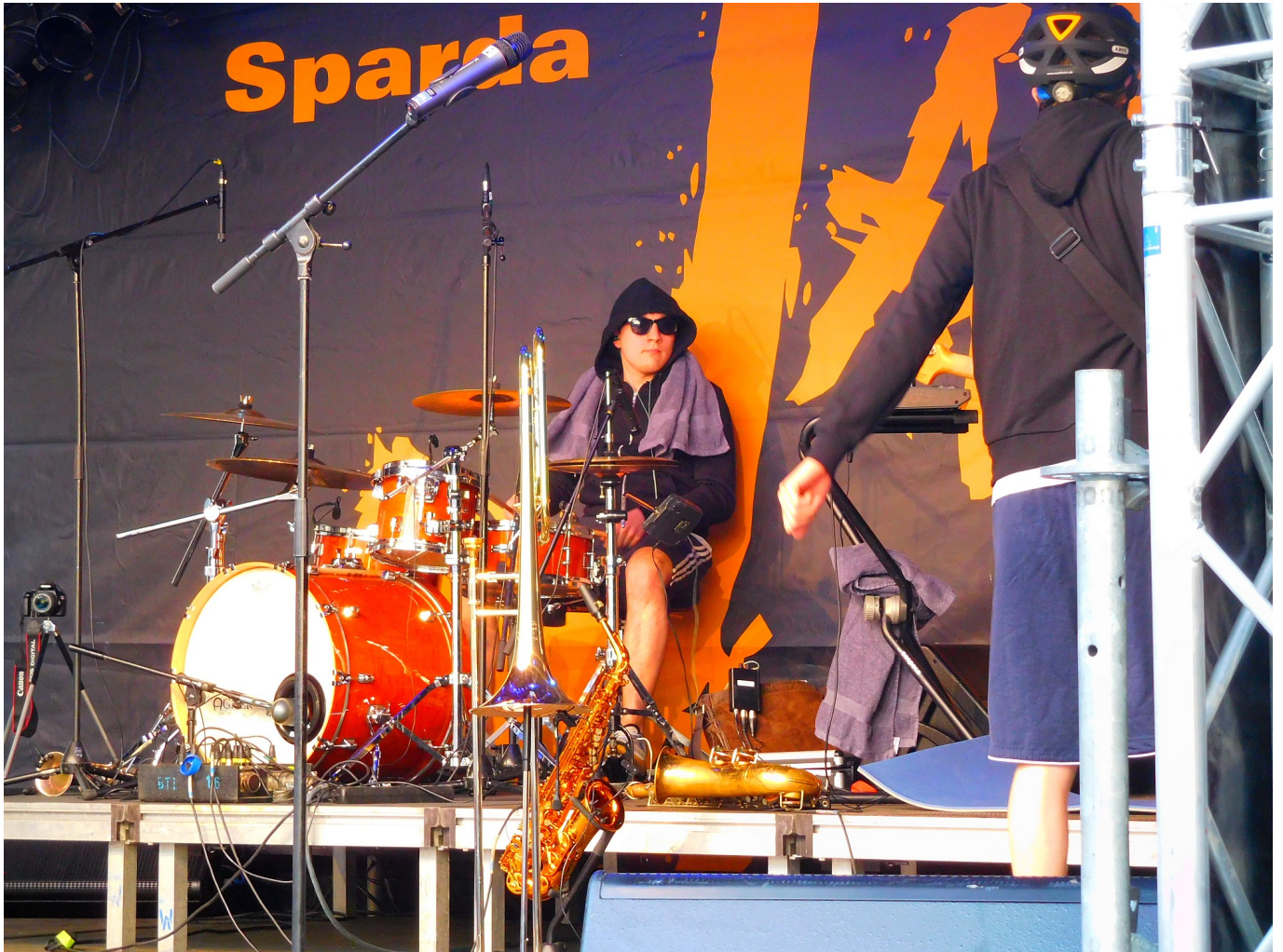
Jazz-Rally 2016: die Rhythmusportgruppe auf der Bühne auf dem Marktplatz