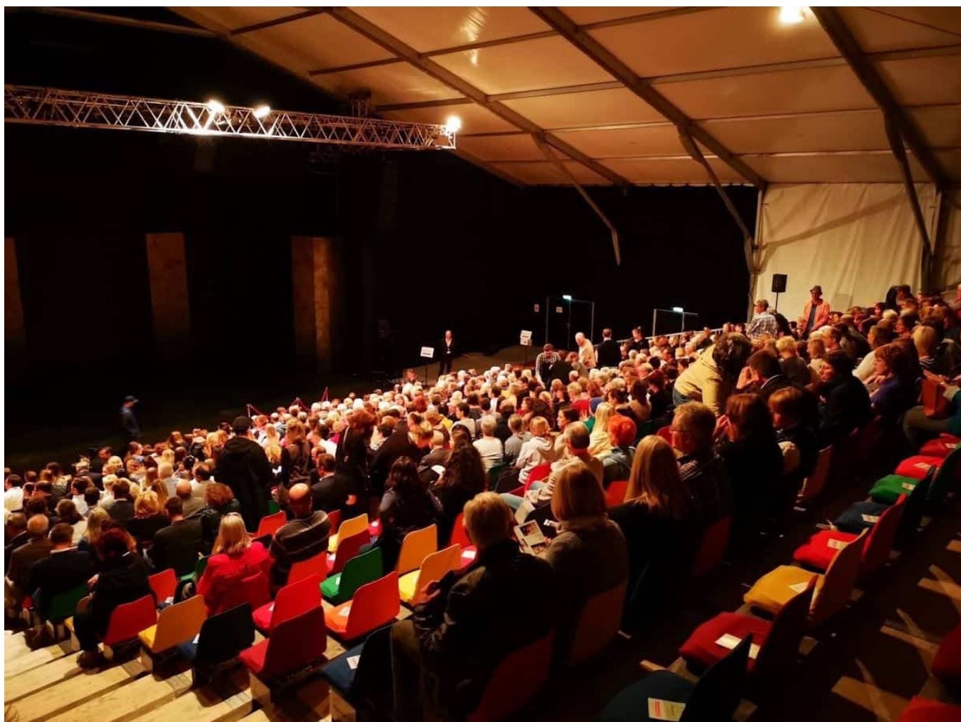
Im Zelt beim düsseldorf festival