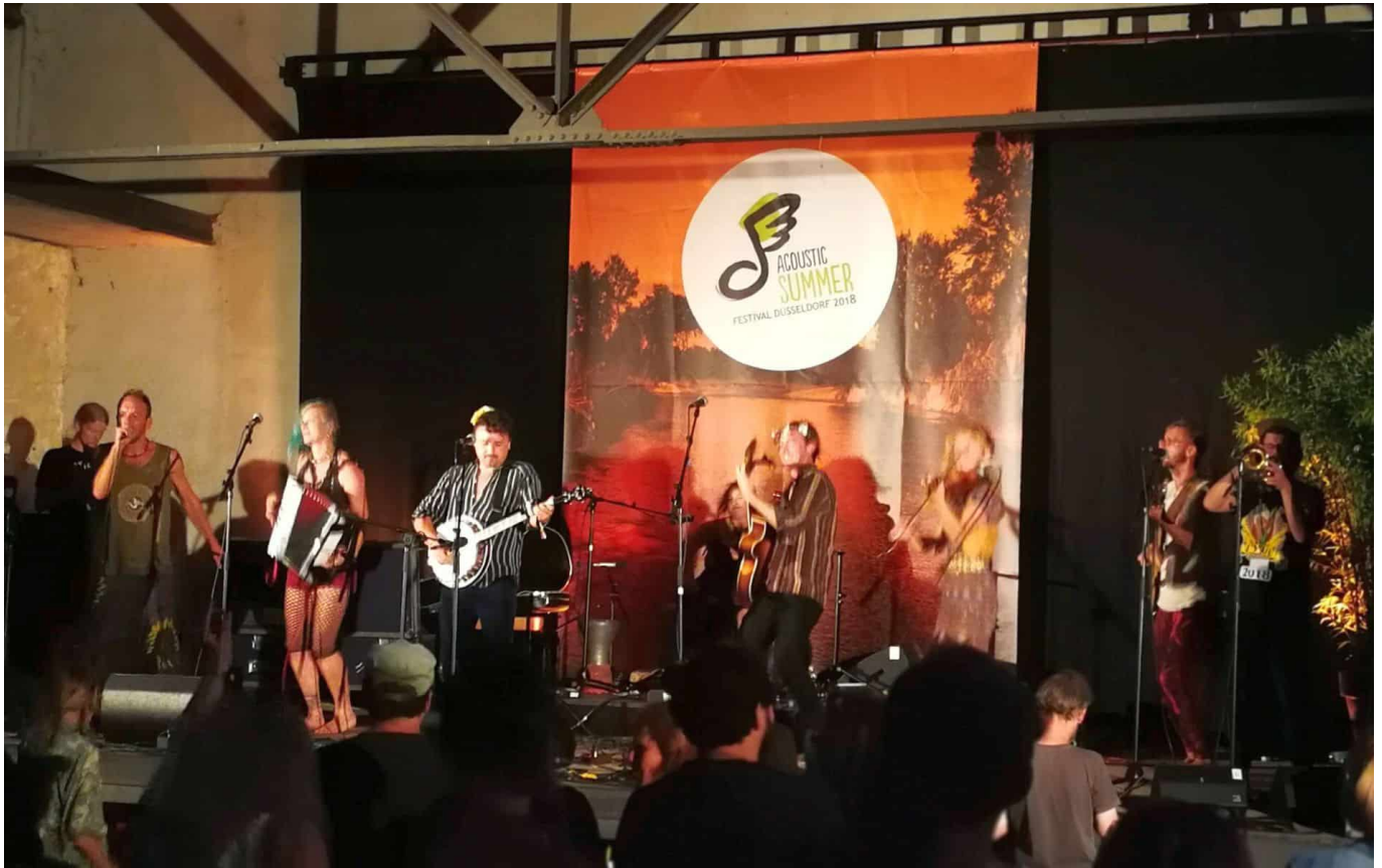
So schön war es beim Acoustic Summer 2018