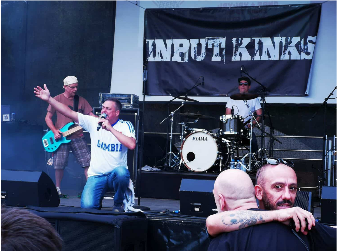
2019: Input Kinks bei Rock gegen Rechts

Minifestival namens „Rock Gegen Rechts“ am 30. Juli statt.