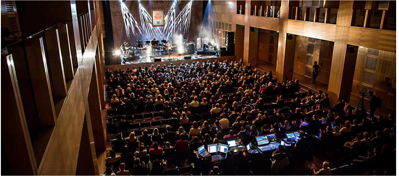
New Fall Festival: Stammplatz Robert-Schumann-Saal