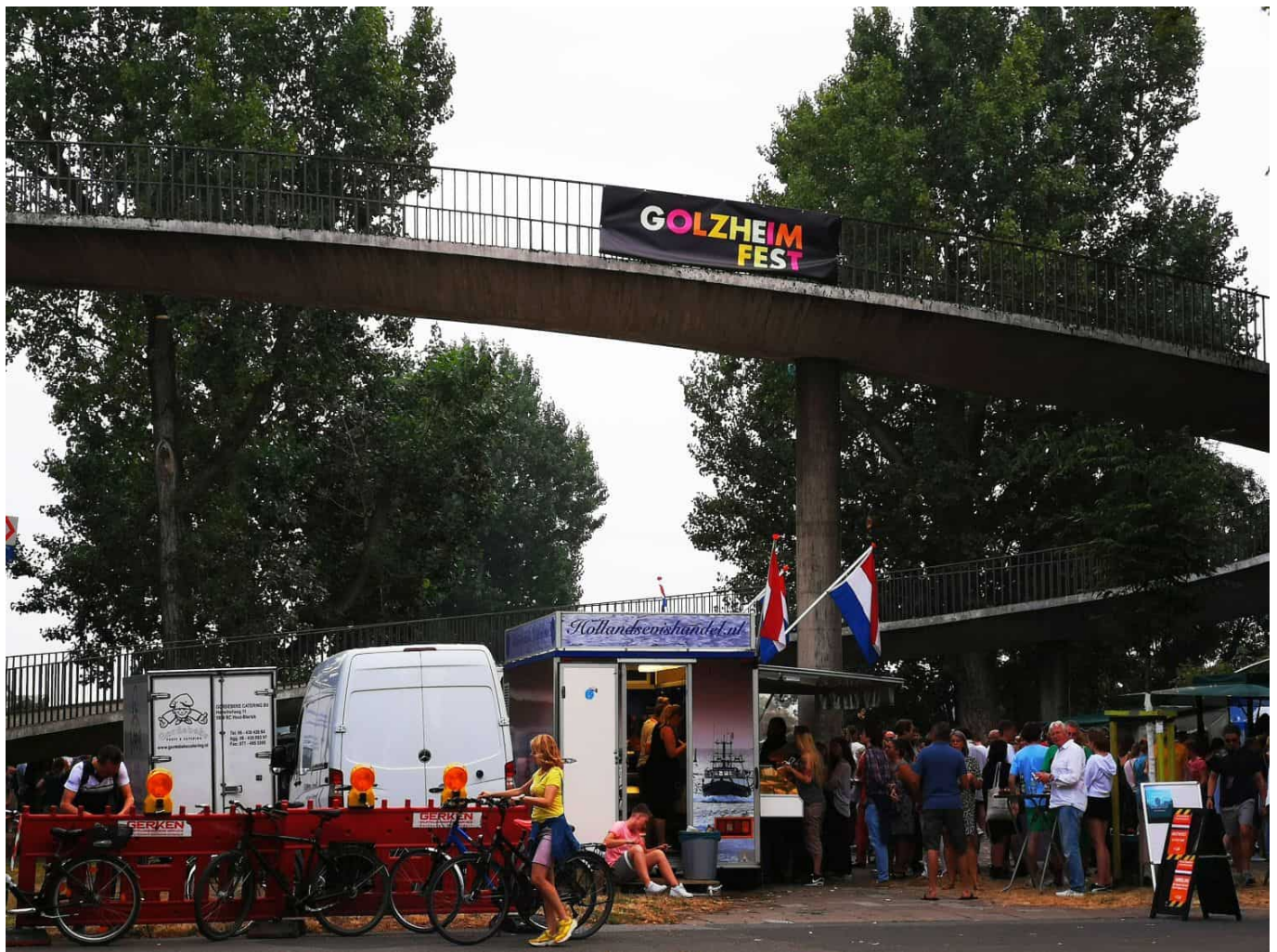
Das Golzheim-Fest 2019 unter der Theodor-Heuss-Brücke