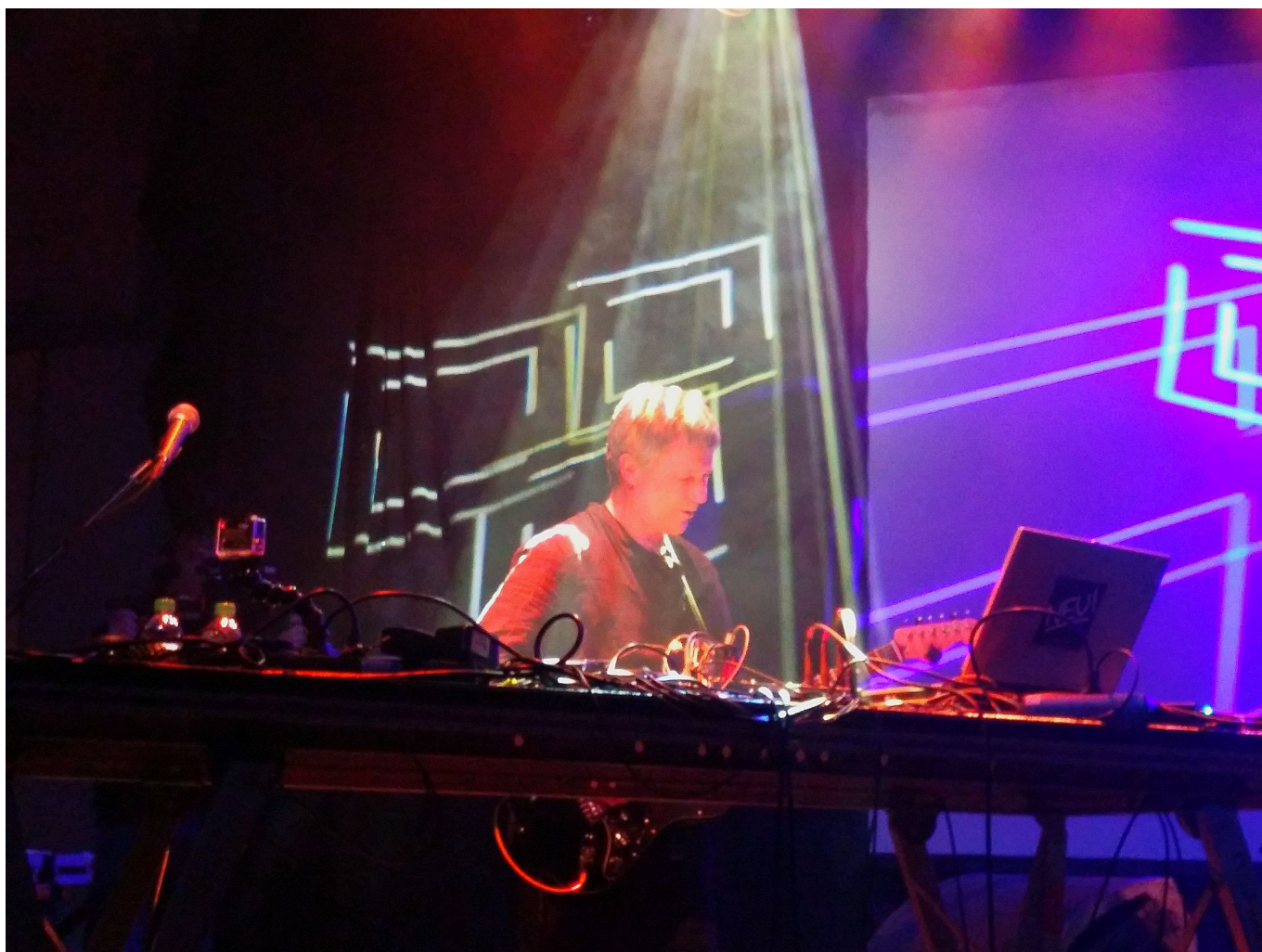
Michael Rother beim Lieblingsplatte-Festival 2016