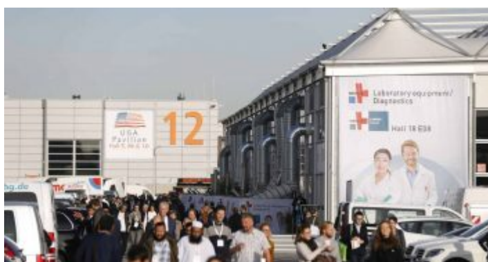
Medica – eine größere Medizinmesse gibt's nicht

Man sagt, die Besucher der jährlichen Medica, die ja eigentlich mit Gesundheit zu tun haben, würden für den größten Umsatzsprung in den Wirtschaften sorgen. Das könnte stimmen, weil man in diesen Tagen überall kleine Gruppen von Medica-Leuten sitzen sieht, die gern tratschen und auch mal zwischengeschlechtliche Aktivitäten anstreben. Auch wenn diese Messe ziemlich groß ist, bringt sie nicht solche Massen in die Stadt wie die K oder die Metallmessen.