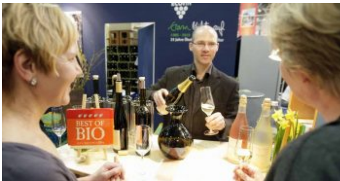
ProWein, zum Leidwesen mancher Menschen nur eine Fachmesse

Diese Messe rund um den Rebensaft ist eine Fachmesse. Deshalb dürfen eben Normaltrinker nicht einfach hin, um sich probierend die Hucke voll zu saufen. Weil aber auch Amateure, die nicht bloß schmarotzen wollen, nicht rein dürfen, liest und hört man in den Tagen vor der ProWEIN überall in der Stadt: „Ey, weißte wie ich an ein Ticket für die Weinmesse komme?“ Die gute Nachricht ist, dass es während der Messe an mehreren Orten in Düsseldorf verstärkt Informationen rund um Wein gibt ... und man auch probieren kann.