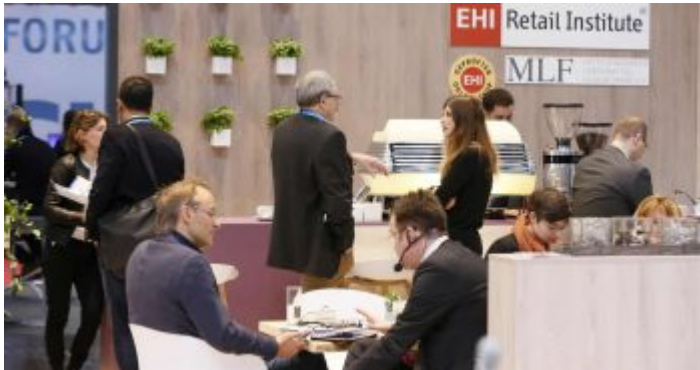
Auf der EuroCIS, der Messe fürs Verkaufen

Gut, die Fachleute werden wissen, was mit „Retail Technology“ gemeint ist, den Laien interessiert die EuroCIS deshalb eher wenig. Dabei ist Otto Normalkonsument ständig von dem betroffen, was auf dieser Messe ausgekaspert wird. Jedenfalls kommen an drei Tagen die europäischen Experten für Verkaufs-, Kommunikations- und Sicherheitstechnik zusammen und werden sich abends sicher in Maßen dort rumtreiben, wo man in Düsseldorf abends gern ist.