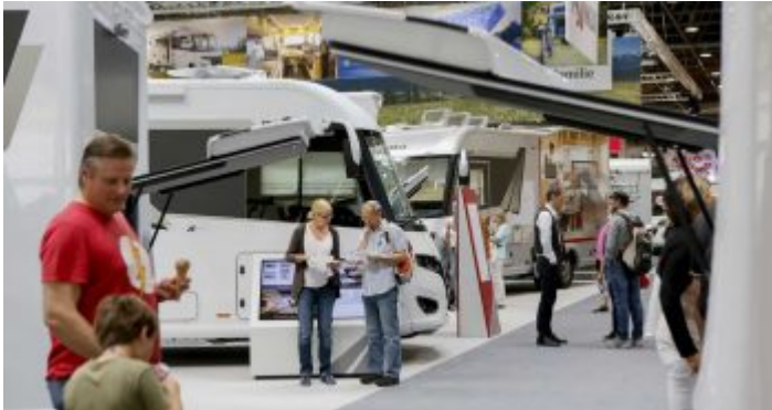
Alles rund ums Wohnen auf Rädern – der Caravan Salon

Ja, das Wohnen auf Rädern lockt die Massen – mal mehr, mal weniger. Und ob es in der Branche der Wohnwagen und Reisemobile gerade auf oder ab geht, kann man auch am Ansturm auf den jährlichen Caravan-Salon ablesen. Das Tolle an dieser Messe: Da ist wirklich für jeden was dabei. Man sieht Superluxusreisegefährte für Preise jenseits der Millionengrenze, aber auch Anhänger für kleines Geld. Und weil die Menschen, die diesen Dingen zuneigen, allesamt viel Ahnung haben, kann man überall ausgesprochen fachliche Diskussionen verfolgen. In der Stadt merkt man von dieser Messe indes eher wenig.