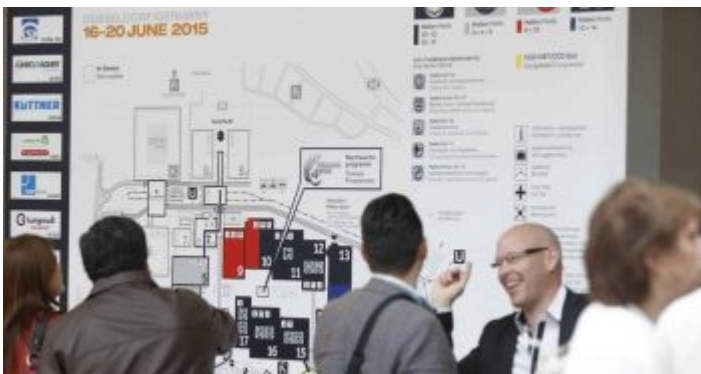
GMNT – wenn sich alles ums Metall dreht

Im Juni heißt es: Ich bin vier Messen in einer, denn was die Messeleute elegant GMNT abkürzen, besteht aus den Komponenten GIFA, METEC, NEWCAST und THERMPROCESS – alles samt Veranstaltungen um das Thema, was man mit Metall Nützliches anstellen kann. Der Vierling unter den Messen spült alle vier Jahre haufenweise trinkfeste Gesellen aus allen Ecken der Erde nach Düsseldorf, was nicht nur zur Füllung der Bierausgabelokale führt,