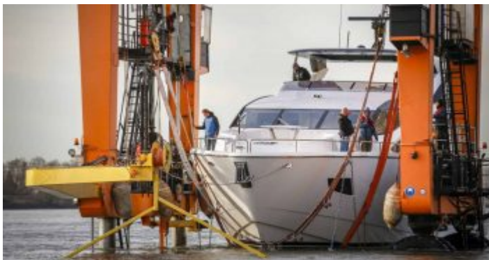
Der Kran „Big Willi“ – Maskottchen der boot

Unglaublich, aber wahr: Die boot feiert dieses Jahr ihren 50. Geburtstag. Dass diese Messe inzwischen mehr ist als nur eine Ausstellung für Freizeitkapitäne, dürfte sich herumgesprochen haben, denn die Palette der Angebote, die mehr als eine Woche lang das gesamte Messegelände füllen, reicht von absoluten Luxusyachten bis hin zur Bekleidung für jegliche Art Wassersport. Wer also irgendein Interesse an der Freizeit am oder im nassen Element hat, sollte sich die boot einmal antun.