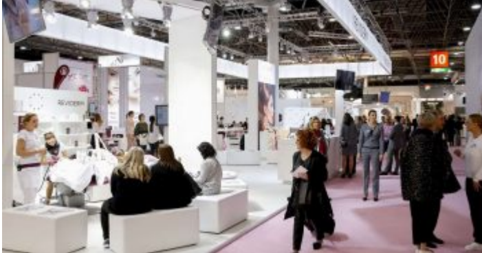
Beauty Düsseldorf – Schönheit kommt nicht nur von innen

Wenn Beauty in der Stadt ist, kommt es am Hauptbahnhof schon mal zu skurrilen Begegnungen zwischen Fortunafans im vollen Outfit und Damen verschiedensten Alters, sie offensichtlich jede Menge Selbstversuche mit kosmetischen Produkten aller Art unternommen haben. Aber es strömen auch andere Mitgliederinnen des weiblichen Geschlechts hoch zur Messe in der Hoffnung, ein bisschen was darüber zu lernen, wie frau demnächst schöner werden kann.