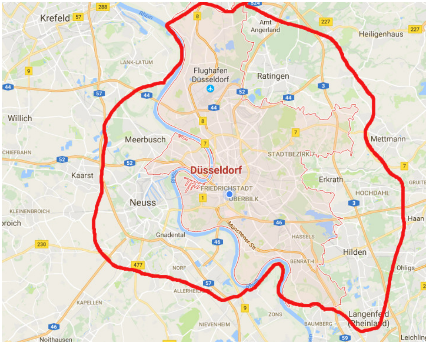
Düsseldorf, die Millionenstadt – ab 2022