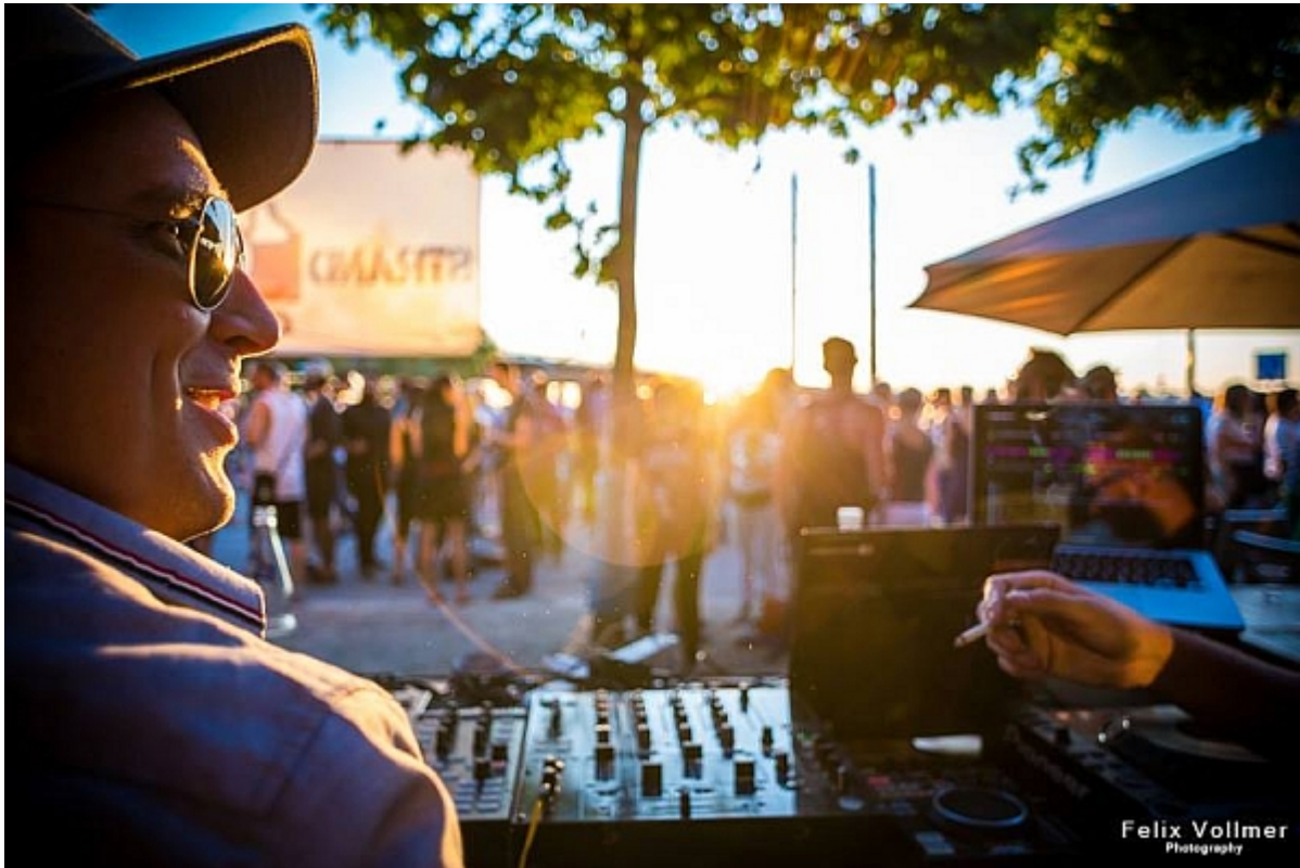
Party am KIT oberhalb der Apollowiese

8. Fortun a- Punkte : Kaderp lanung 18/19 - von Achsen , Lücken und Absich erunge n [22.09 9x]