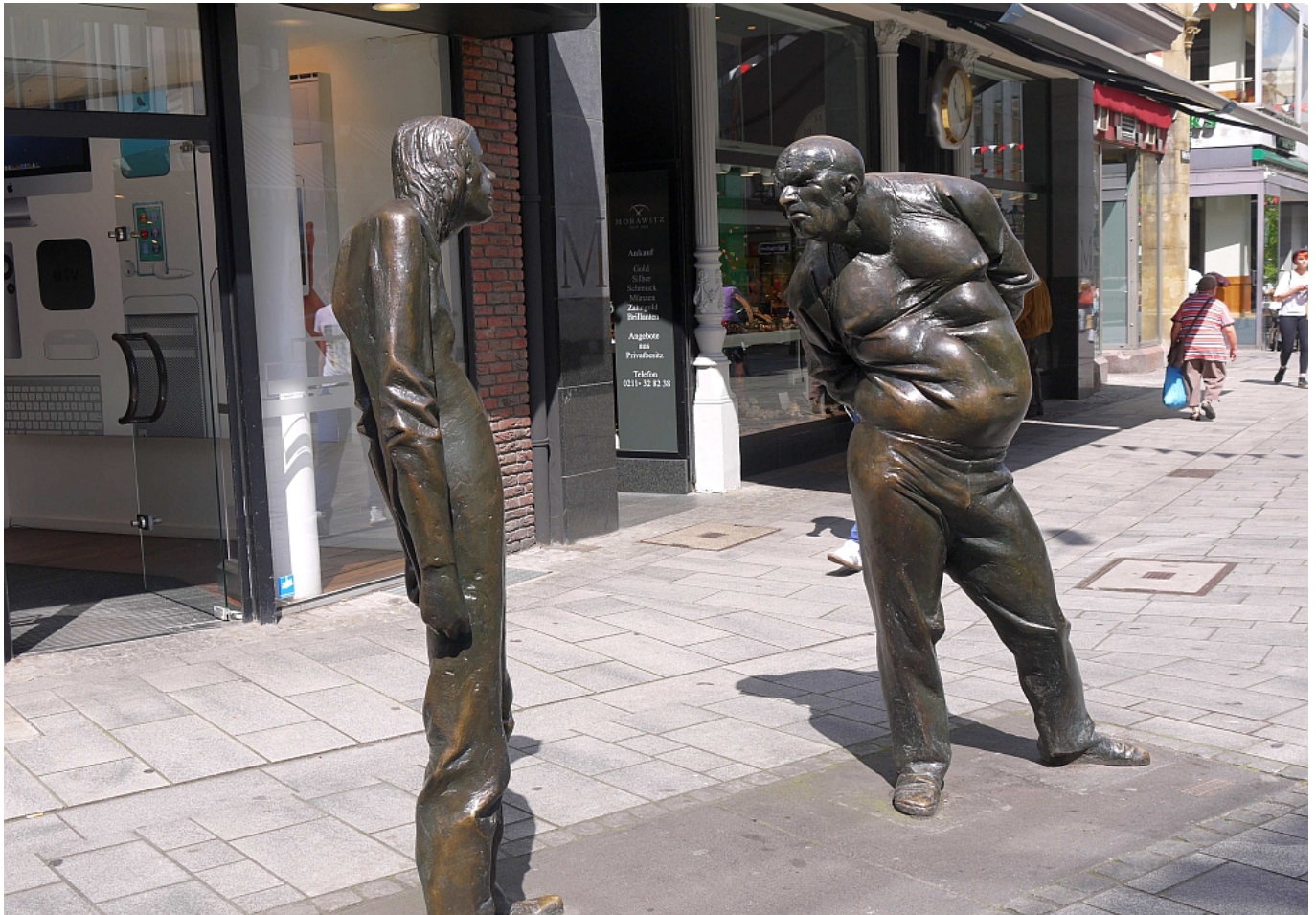
Die Streitenden - bestimmt auf Mundart