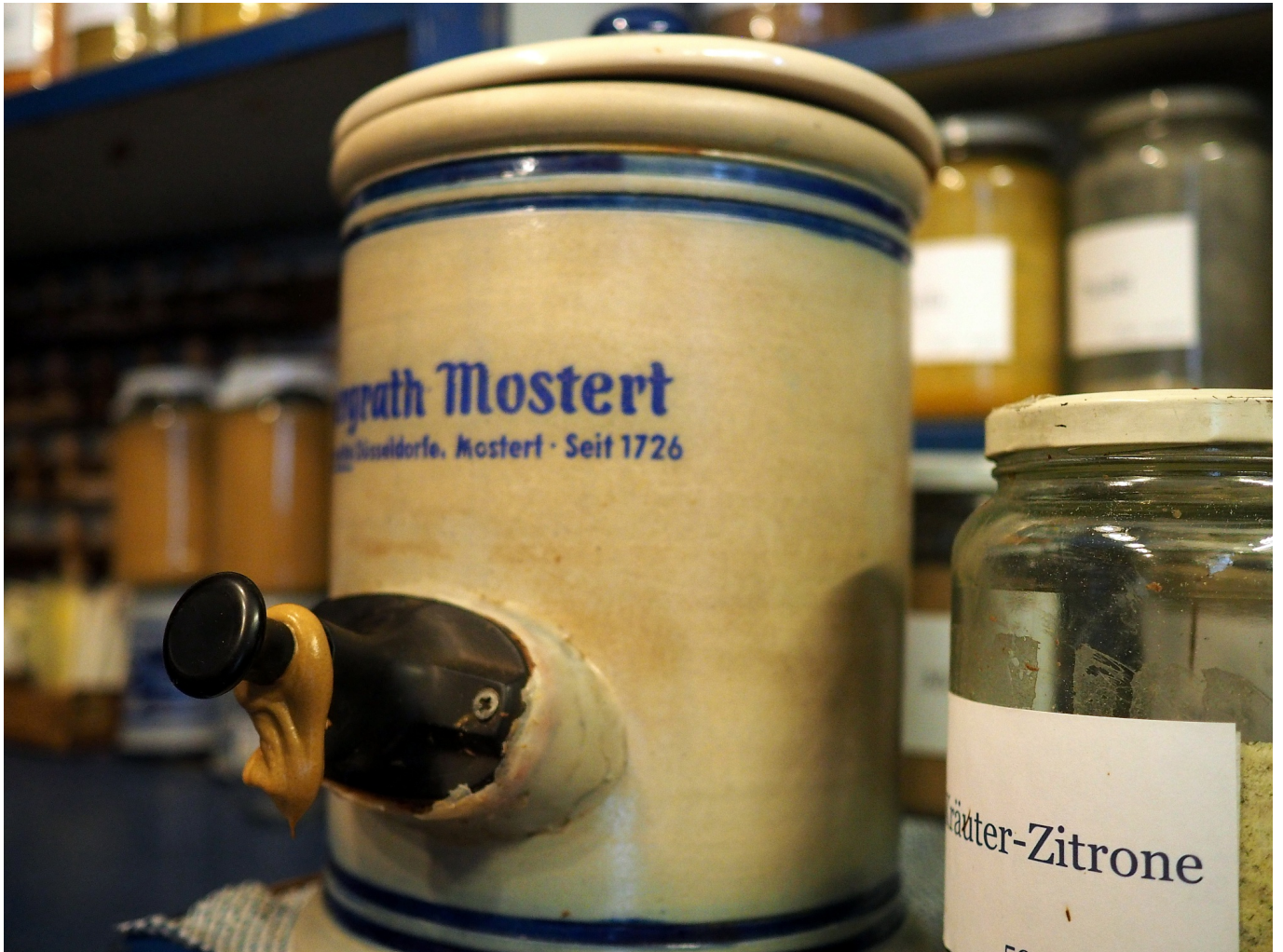
Die Mostertpumpe