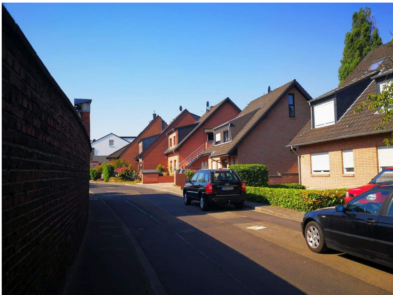
Der Wormser Weg im Gurkenland