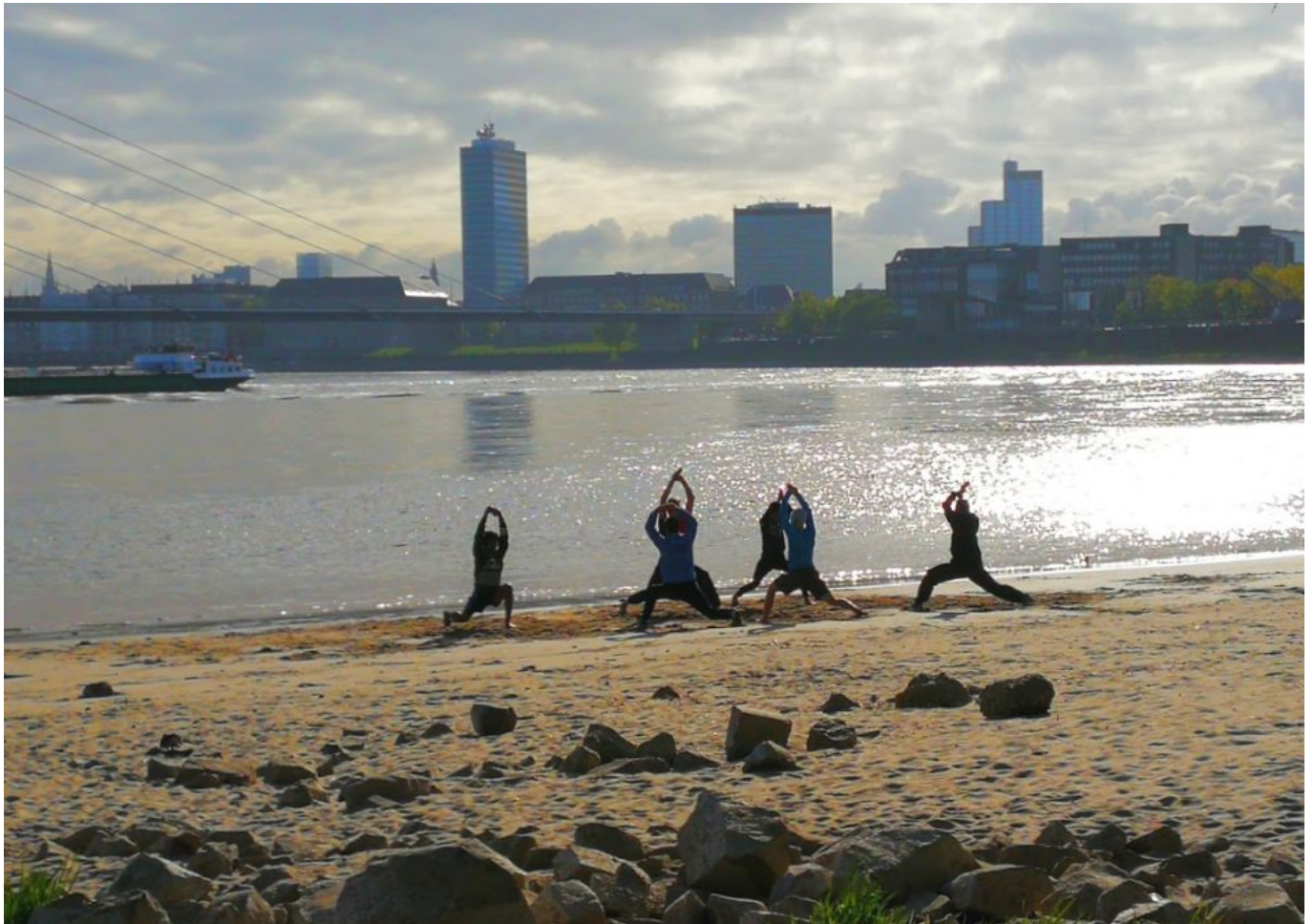
Training am Paradiesstrand